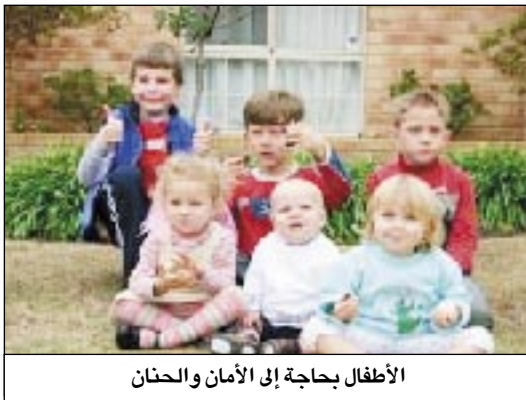
الأطفال بحاجة إلى الأمان والحنان

النفسي إضافة إلى عدم التعويد على التبول ليلاً في التواليت وإلى حين بلوغ السيطرة التامة على إفراغ المثانة.