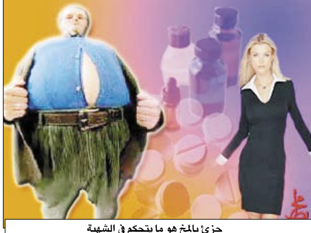
جزءاً بالمش هو ما يتحكم في الشهية

على السمنة المفرطة توصل علماء يابانيون إلى اكتشاف جزئي مسؤول في منطقة المخ يسمى الهيبوثالاموس يتحكم في زيادة أو نقص الشهية. وأوضح العلماء أن هذا الجزء يتم إنتاجه بشكل طبيعي في المخ وبعد حقن هذا الجزء في مخ الفئران، انخفض أن هذه الفئران بدأت في الأكل بشكل أقل وفقدت الوزن. وأشار العلماء إلى أن هذا الاكتشاف قد يؤدي إلى طرق جديدة لعلاج البدانة عند البشر.