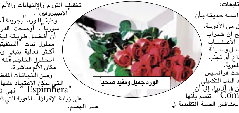
الورد جميل ومفيد صحياً

تخفيف التوتر والإلتهابات والألم مثل الإيبيروفين. وطبقاً لما ورد بجريدة أخبار سوريا، وأوضحت الدراسة أن أفضل طريقة ليكون محلول نبات السنطيتون أكثر فعالية ينبغي وضع المحلول الناجم عنه على مكان الألم مباشرة. ومن النباتات المفصلة التي يمكن الاعتماد عليها هي "Espimhera" فهي تعمل على زيادة الإفرازات المعوية التي تعالج عسر الهضم.