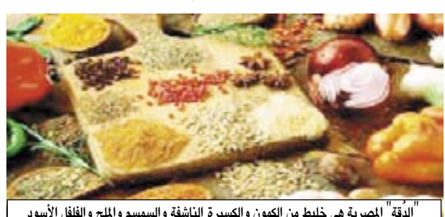
«الدقة» المصرية هي خليط من الكون والكسبرة النافثة والسهم والملح والفلفل الأسود