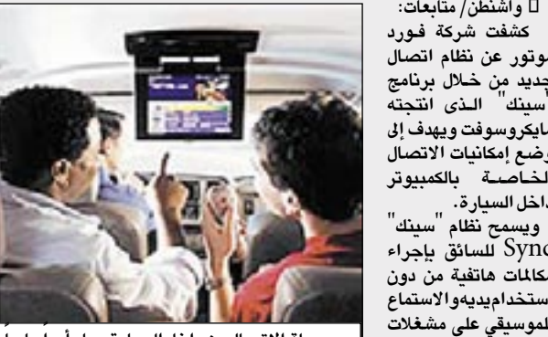
سهولة الاتصال من داخل السيارة صار أمراً عادياً

واشنطن/متابعات: كشفت شركة فورد موتور عن نظام اتصال جديد من خلال برنامج "سينك" الذي انتجته مايكروسوفت ويهدف إلى وضع إمكانيات الاتصال الخاصة بالكمبيوتر داخل السيارة. ويسمح نظام "سينك" SYNC للسائق بإجراء مكالمات هاتفية من دون استخدام يديه والاستماع للموسيقى على مشغلات وسائل رقمية بما في ذلك (آي بود) iPod الذي تنتجه شركة آبل والإطلاع صوتياً على الرسائل التي ترد على الهاتف المحمول. ويسمح برنامج سينك أيضاً للمستخدمين من خلال تقنية البلوتوث اللاسلكية بتشغيل هواتفهم المحمولة من خلال أوامر صوتية أو من خلال أزرار التحكم الموجودة على عجلة القيادة. ولم تذكر مايكروسوفت ما إذا كانت تعتزم منح "سينك" لشركات أخرى لصناعة السيارات إلا أنه من المتوقع أن يكون هناك فرصة لتركيبة البرنامج في أكثر من 600 مليون سيارة في مختلف أنحاء العالم.