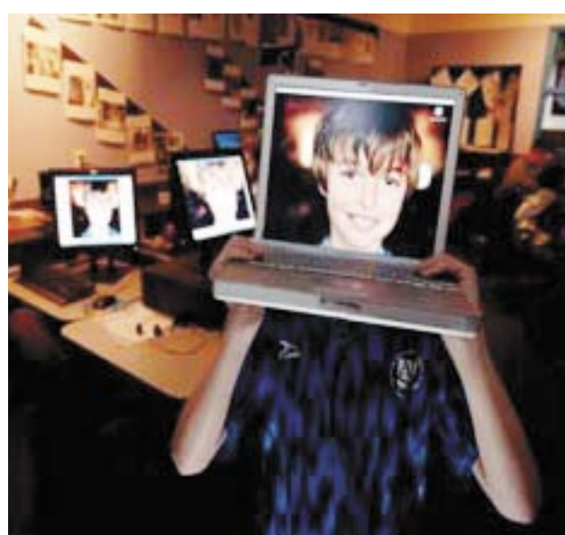
واشنطن/متابعات: كشفت شركة إنتل العالمية النقاب عن ثلاثة معالجات رباعية النوى موجهة لقطاعات الأجهزة المكتبية والشركات.