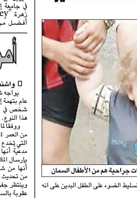
ثلث الأطفال الذين تجري لهم عمليات جراحية هم من الأطفال السمان

واشنطن/متابعات: أظهرت دراسة أمريكية أجراها مركز "ان آربرو الطبي" لجامعة ميتشيجان أن ثلث الأطفال الذين تجري لهم عمليات جراحية بدناء، مما يزيد من خطر تعرضهم لتعقيدات مرتبطة بالجراحة. وطبقاً لما ورد بجريدة اليوم، أجرى الدكتور اولوبوكولا أو نافيو القائم على الدراسة وزملاؤه على 6٠٧ طفلاً عمليات جراحية في مستشفى يو-ام فيما بين عامي ٢٠٠٤ و٢٠٠٤، ووجدوا أن ٣٦% منهم أوزانهم زائدة أو بدناء، مع تصنيف ١٠% على أنهم بدناء، و٥% على أنهم بدناء بشكل مرضي. وأشارت النتائج التي نشرت في دورية الجمعية الطبية الوطنية إلى أنه بناء على تحدييدات معينة مثل السن والنوع كان ١٤% من الأطفال أكثر من الوزن العادي، و١٧% بدناء. وقال الدكتور اولوبوكولا أو نافيو " أن دراستنا والدراسات التي تليها تساعدنا في تسليط الضوء على الطفل البدن على أنه مرشح بشكل خطير جدا للجراحة ومن ثم يستحق اهتماما اضافيا".