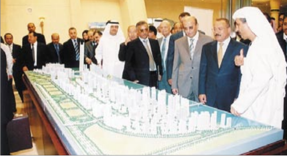
صنعا / 14 أكتوبر: عاد إلى أرض الوطن يوم أمس فخامة الأخ الرئيس علي عبدالله صالح رئيس الجمهورية والوفد المرافق له بعد زيارة لدولة الإمارات العربية المتحدة لتلبية لدعوة من أخيه سمو الشيخ خليفة بن زايد رئيس دولة الإمارات العربية دامت يومين.

وجرى خلال الزيارة التباحث حول سبل تعزيز العلاقات الأخوية ومجالات التعاون المشترك بين البلدين الشقيقين والتشاور وتبادل وجهات النظر إزاء المستجدات وتطورات الأوضاع الراهنة وفي مقدمتها الوضع في فلسطين والعراق ولبنان والصومال إلى جانب الملف النووي الإيراني. وأكد الزعيمان علي عبدالله صالح وخليفة بن زايد حرصهما على تعزيز وتطوير العلاقات الثنائية والدفع بها نحو مجالات أوسع بما يخدم المصالح المشتركة للبلدين والشعبي الشقيقين، كما أكد حرص البلدين على تنسيق مواقفهما لخدمة مسيرة التضامن والعمل العربي المشترك وبخاصة في ظل التحديات الراهنة التي تواجهها الأمة. وكان فخامة الأخ الرئيس قد توجج زيارته لدولة الإمارات العربية المتحدة يوم أمس بزيارة لإمارة دبي حيث أطلع على ما شهدته من تطور ونهضة عمرانية واقتصادية واستثمارية كبيرة ومتسارعة، كما أطلع على الأنشطة التجارية والاستثمارية لميناء جبل علي وكذا أنشطة المنطقة الحرة في دبي وشركة موانئ دبي العالمية. التفاصيل ص 3