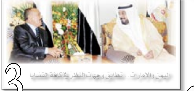
البحر والامارات - تطابق وجهات النظر كافة القضايا