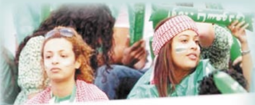
Koorah.com - Gulf Herald, Jafar Ali