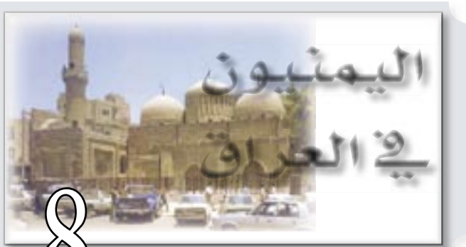
اليمنيون في العرين

اهداف الثورة اليمنية ● التحرر من الاستبداد والاستعمار ومخلفاتهما واقامة حكم جمهوري عادل وإزالة الفوارق والامتيازات بين الطبقات. ● بناء جيش وطني قوي لحماية البلاد وحراسة الثورة ومكتسباتها. ● رفع مستوى الشعب اقتصاديا واجتماعيا وسياسيا وثقافيا. ● إنشاء مجتمع ديمقراطي تصاوني عادل مستمد أنظمتها من روح الإسلام الحنيف. ● العمل على تحقيق الوحدة الوطنية في نطاق الوحدة العربية الشاملة. ● احترام مواثيق الأمم المتحدة والمنظمات الدولية والتمسك بمبدأ الحياد الإيجابي وعدم الانحياز والعمل على إقرار السلام العالمي وتدعيم مبدأ التعايش السلمي بين الأمم.