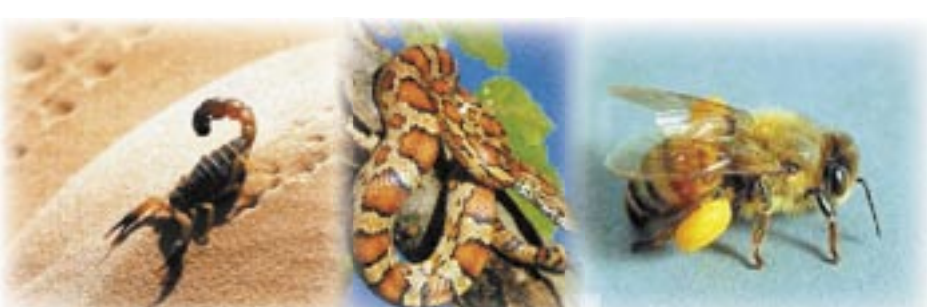
لوس انجلس / متابعة: سوسم العقرب.. لسرطان بالخشع