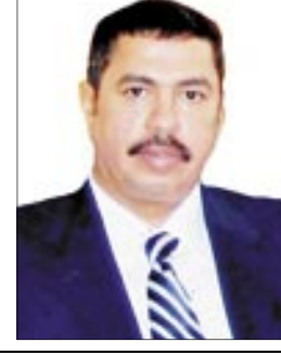
صنعاء / سبأ : وصف الأخ خالد محفوظ بحاج وزير النفط والمعادن نتائج مشاركته في المؤتمر العالمي السابع للنفط والغاز الطبيعي الذي اختتم أعماله بالعاصمة الهندية نيودلهي مؤخرا بأنها كانت ناجحة بكل المقاييس .

□ صنعاء / سبأ : وصف الأخ خالد محفوظ بحاج وزير النفط والمعادن نتائج مشاركته في المؤتمر العالمي السابع للنفط والغاز الطبيعي الذي اختتم أعماله بالعاصمة الهندية نيودلهي مؤخرا بأنها كانت ناجحة بكل المقاييس . وذكر الوزير بحاج لوكالة الأنباء اليمنية /سبأ/ لدى عودته والوفد المرافق له إلى مطار صنعاء الدولي أمس الأحد أنه عرض أمام 4000 خبيرة من مختلف دول العالم سواء الهندية أو المستوردة للنفط والغاز الطبيعي وكذلك