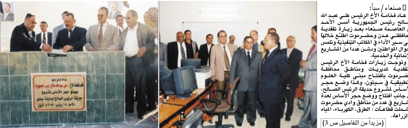
صنعاء / سبأ : عاد فخامة الأخ الرئيس علي عبد الله صالح رئيس الجمهورية أمس بعد زيارة تفقدية لمحافظة عدن وحضرموت لافتتاح مبنى كلية العلوم التطبيقية في سيئون ، وكذا وضع حجر الأساس لمشروع حديقة الرئيس الصالح ، إلى جانب افتتاح ووضع حجر الأساس لعدد مشاريع في عدن من مناطق وادي حضرموت وشملت قطاعات : الطرق ، الكهرباء ، المياه والزراعة . (مزيدا من التفاصيل ص 3)