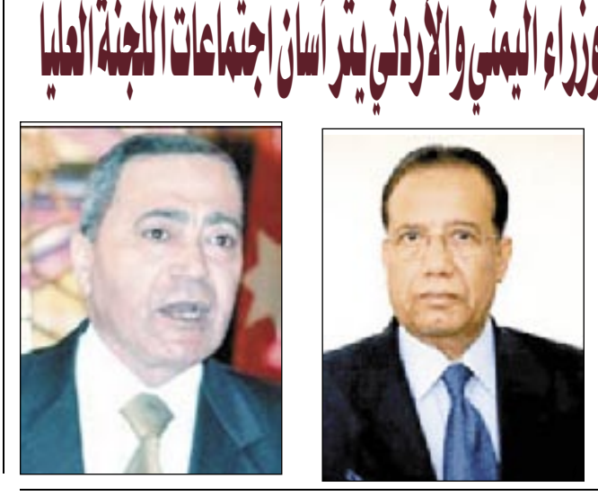
الأتين المقبل.. رئيس الوزراء اليمني والأردني يترأسان اجتماعات اللجنة العليا

استدعاء أصحاب المشاريع الاستثمارية التي لم تنفذ عدن / سبأ: أقرت اللجنة المتبقة عن المكتب الاستشاري للاستثمار بمحافظة عدن خلال اجتماعها أمس الخميس ممثلين من الغرفة التمتة ص 2