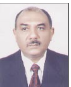
14 أكتوبر: ( أنهم يعملون هناك بصمت وكفاح واجتهاد رغم الظروف الصعبة والإمكانيات الشحيحة).

ويتلقى برقية تهنئة من رئيس الوزراء بمناسبة العام الهجري الجديد صنعا / متابعات: رفع الأخ عبدالقادر باجمال رئيس مجلس الوزراء برقية تهنئة إلى فخامة الأخ الرئيس علي عبدالله صالح رئيس الجمهورية بمناسبة العام الهجري الجديد وذكرى الهجرة النبوية الشريفة على صاحبها أفضل الصلاة وأزكى التسليم. وعبر الأخ رئيس الوزراء في برقيته لفخامة الأخ الرئيس عن أسى وأصدق التهاني بهذه المناسبة الدينية الجليلة، المفعمة بالدروس والدلالات والمعاني والروحية العبدية. وأشار إلى أن الهجرة النبوية الشريفة شكلت نقطة فارقة وضيئة في تاريخ الأمة والبشرية بشكل عام، صاغ على إثرها الرسول الأعظم محمد صلى الله عليه وسلم العهد الجديد للإنسانية بتحريرها من ربقة الجهل وتخليصها من عبود الرق والوثنية. التمتة ص 2