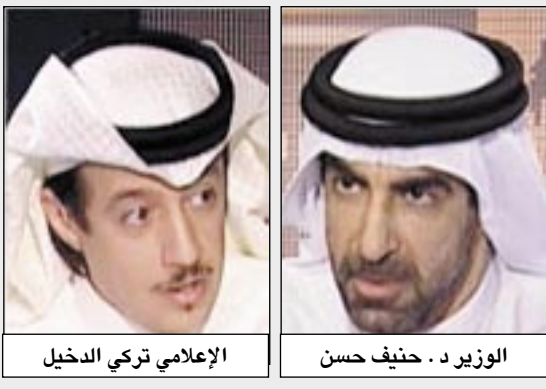
الوزير د. حنيف حسن والإعلامي تركي الدخيل

كشف عن إيقاف عدد من المدرسين «الذين عبثوا بشكل خطير بعقول الطلاب» وزير التعليم الإماراتي ينتقد تعليم الأطفال «الغيبيات» في الروضة والمدرسة الابتدائية أبو ظبي / متابعات: انتقد وزير التربية والتعليم الإماراتي د. حنيف حسن تعليم الأطفال في الروضة والمرحلة الابتدائية مناهج حول العقائد والغيبيات في الإسلام، مشيرا إلى أن وزارته أنهت إعداد وثيقة لتطوير المناهج الإسلامية في بلاده كاشفا عن إيقاف عدد من المدرسين «الذين عبثوا بشكل خطير بعقول الطلاب». وجاء حديث الوزير حنيف حسن في حوار مع برنامج «إضاءات» من تقديم الإذاعي تركي الدخيل والذي تبث حلقة قناة (العربية) اليوم في الساعة الثانية ظهرا ويعد بثه الثلاثاء في منتصف الليل. وقال د. حنيف حسن إن وزارته أعدت وثيقة حول المعايير التي يجب أن تكون في المناهج الإسلامية من الصف الأول الابتدائي وحتى الصف الثاني عشر، وأضاف: يجب أن تراعى عمر الطالب والقيم التي يحتاجها بشكل يتناسب مع عمره، فوجب ألا يتم تعليم الأطفال في الروضة والمرحلة الابتدائية العقائد والغيبيات لأنها لا تتناسب مع عمره. ونفى وزير التربية والتعليم الإماراتي أن يكون سعي حكومة بلاده لتغيير المناهج الإسلامية قد تم تحت ضغوط وردا على سؤال الزميل تركي حول وجود حديث عن تجديد معنية، لافتا إلى هذه التغييرات كان يجب أن تتم قبل أكثر من 30 سنة ويحد أن تتناسب المناهج مع الوسطية في الإسلام ولا تخضع المناهج لكفر ساند في دولة ما. وردا على سؤال الزميل تركي حول وجود حديث عن تجديد تجربة الدول المتقدمة.