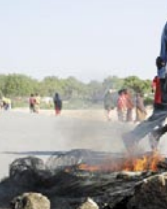
ت/ علي الدرب

بيدوة/وكالات: أعلن البرلمان الصومالي أمس السبت حالة الطوارئ لمدة ثلاثة أشهر وسط مخاوف من العودة لأعمال العنف القبلية بعد أسابيع من القتال الذي أطاح بمليشيا المحاكم الإسلامية. وصوت أعضاء البرلمان في مقر الحكومة المؤقتة في بيدوة موافقة 154 عضواً واعترض صوتين للتصديق على خطة رئيس الوزراء الصومالي علي محمد جيدي. وتواجه الحكومة تحدياً كبيراً بحلول السلام والأمن للبلاد الواقعة في منطقة القرن الأفريقي. وقال عثمان علمي بوقره النائب الثاني لرئيس البرلمان الصومالي أمام المجلس التشريعي "تم التصديق على حالة الطوارئ لمدة ثلاثة أشهر. وإذا اقتضت الضرورة إن تمدد الحكومة الفترة فسيتعين على الرئيس عندئذٍ أن يطلب موافقة البرلمان على ذلك. وحاول رجال مليشيات الجمعة شق طريقهم بالقوة إلى داخل