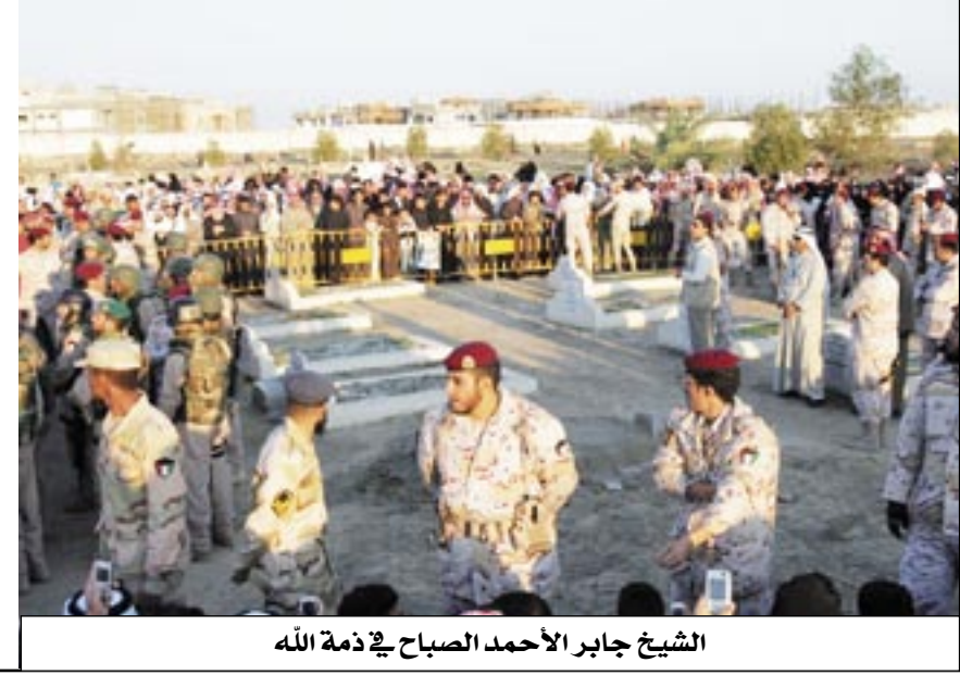
الشيخ جابر الأحمد الصباح في ذمة الله