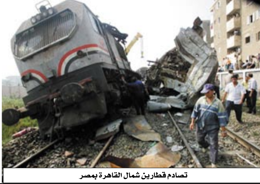
تصادم قطارين شمال القاهرة بمصر