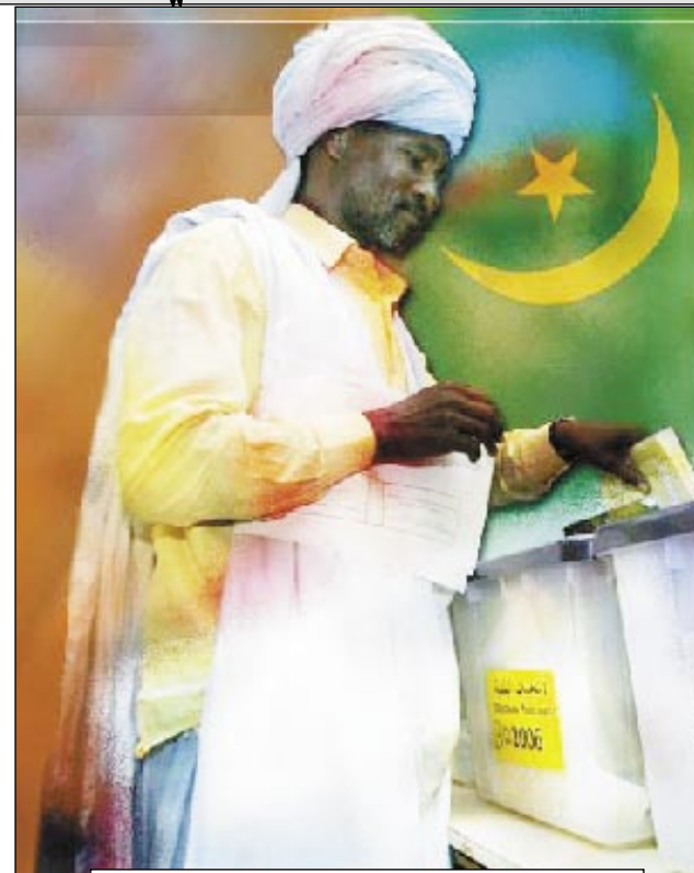
الانتخابات في موريتانيا

جدد الرئيس التونسي زين العابدين بن علي رفضه للحجاب الذي يعتبره القانون التونسي زيا طائفا دخيلا على البلاد، إلا أنه لم يمانع في أن ترتدي