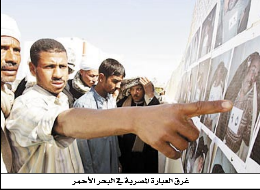
غرق العبارة المصرية في البحر الأحمر