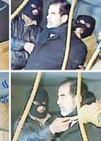
سام عبدالله الغباري

نعم سيادة الشهيد صدام حسين .. لم يكن الذين يغتالونك على حبل مشنقة غليظ على قدر عال من الرجولة كما تخيلت .. ولم يكن العديد من العراقيين الذين وصفتمهم بأبناك ولخو أنك عند مستوى تربيتك وقتت بهم .. فمنهم الكثيرون من ذهبوا إلى درجة الانحطاط الطائفي .. حتى أنهم تناولوا من جسدك السجى بالضربيات والكدمات التي ظهر أثرها على خدك. □ أفكار صدام حسين وتصرفاته ومعاركه وقدراته ورناسته سيأتي اليوم الذي تحاكم فيه بقدر عال من الإنصاف والمسؤولية وسيذكر العراقيون أن هذا الشهيد قدم أبناءه وحفيده في عائلته الصغيرة شهداء في حربهم ضد الغازي المحتل .. وسيف المنصفون امام وصيته الاخيرة بما فيها من العمق والفلسفة والمحبة ليتبينوا أنهم كانوا يقفون امام قائد ذمته ورجل متواضع يحمل سبحات الحبة ويرقى إلى مستوى الزعامة التي تريد ان تقدم لوطنها أقصى ما لديها من طاقات خلاقة. □ كما سيحكم التاريخ بقوة على أن مبادئ الرجولة العراقية نمرت في سنوات الاحتلال الأمريكي البربري للعراق وعلى أن صدام حسين هو الرجل الحقيقي الذي حوكم وأعدم شنقا لصفقة تلك. □ وداعا شهيد الأمة .. واضحة للمسلمين جمعا .. عسى أن يكون لحمت خبز الأمم قوتها .. و دمك ماء تنظير به من تونينا التي كان أولها إفريقيا في فرض الجهاد لمتحرك. □ والله يتولى الصالحين