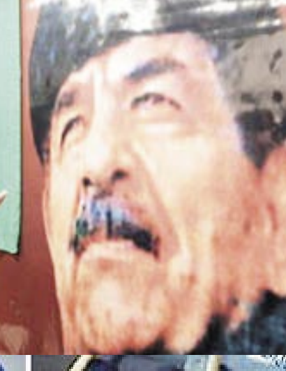
سام عبدالله الغباري

نعم سيادة الشهيد صدام حسين .. لم يكن الذين يغتالونك على حبل مشنقة غليظ على قدر عال من الرجولة كما تخيلت .. ولم يكن العديد من العراقيين الذين وصفتمهم بأبناك ولخو أنك عند مستوى تربيتك وقتت بهم .. فمنهم الكثيرون من ذهبوا إلى درجة الانحطاط الطائفي .. حتى أنهم تناولوا من جسدك السجى بالضربيات والكدمات التي ظهر أثرها على خدك. □ أفكار صدام حسين وتصرفاته ومعاركه وقدراته ورناسته سيأتي اليوم الذي تحاكم فيه بقدر عال من الإنصاف والمسؤولية وسيذكر العراقيون أن هذا الشهيد قدم أبناءه وحفيده في عائلته الصغيرة شهداء في حربهم ضد الغازي المحتل .. وسيف المنصفون امام وصيته الاخيرة بما فيها من العمق والفلسفة والمحبة ليتبينوا أنهم كانوا يقفون امام قائد ذمته ورجل متواضع يحمل سبحات الحبة ويرقى إلى مستوى الزعامة التي تريد ان تقدم لوطنها أقصى ما لديها من طاقات خلاقة. □ كما سيحكم التاريخ بقوة على أن مبادئ الرجولة العراقية نمرت في سنوات الاحتلال الأمريكي البربري للعراق وعلى أن صدام حسين هو الرجل الحقيقي الذي حوكم وأعدم شنقا لصفقة تلك. □ وداعا شهيد الأمة .. واضحة للمسلمين جمعا .. عسى أن يكون لحمت خبز الأمم قوتها .. و دمك ماء تنظير به من تونينا التي كان أولها إفريقيا في فرض الجهاد لمتحرك. □ والله يتولى الصالحين