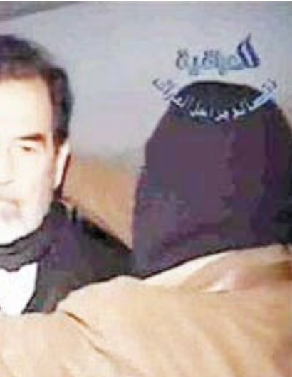
سام عبدالله الغباري

الرجولة عند "صدام حسين" لها اعتباراتها التي لم يتخل عنها عند حبل المنطق الذي اطاح بحياته الحافلة. ولم يكن يعرف الرئيس صدام اسلحة النمار الشامل كانت اجساد وتضاريس الرافعات العراقية التي اطحن بمفهوم الماجدات .. وفي 2003م بعد 13 عاما من الغزو والحصار سقطت أوراق التوت وظهرت الاسلحة المدمرة في أغاني "البرتقال" وتحويلات الماجدات إلى مصطلح يذكر بلإعده التقييم .. وبرزت مبادئ صدام جليلة كرجولة في تحركاته ومواقفه وردود أفعاله بعد انهيار نظامه واقتقاد العراقيين له ويمكن لي تعديد بعض منها: