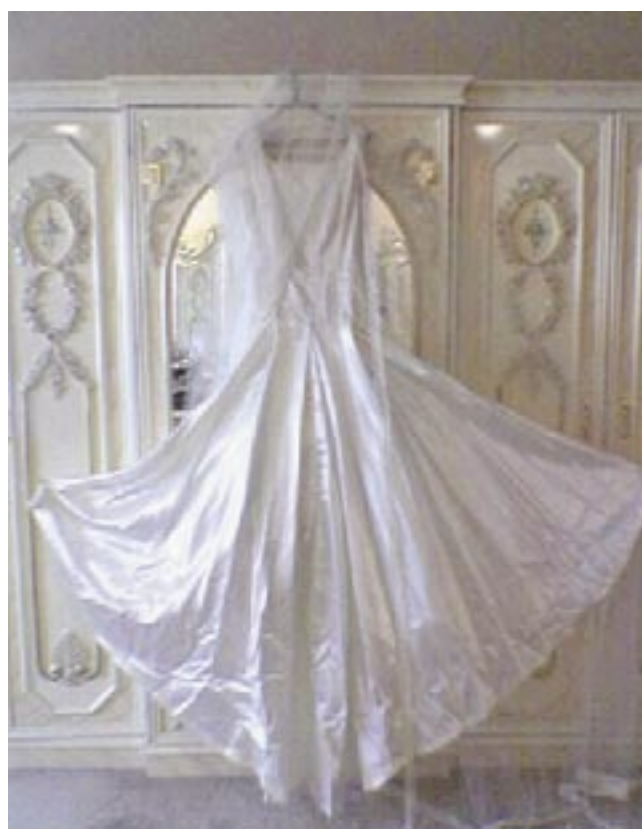
فستان الزفاف.. عندما يتحول إلى درع واقية!

انقرة/متابعات: ابتكرت مصممة أنيابه في مدينة "أنمير"، غرب تركيا، فستان زفاف واقية من الرصاص، يحتوي على صدريه فولانية على غرار القمصين الواقية من الرصاص الذي يرتديه رجال الشرطة. وأشارت خبيرة جينزها مصممة الأنياه، إلى أنها فكرت في ابتكار هذا الفستان، وذلك لأن من عادات بعض المناطق في تركيا إطلاق النار في الهواء أثناء حفلات الزفاف. وطبقاً لما ورد بجريدة الرياض، "أوضحت جينزها أن تصميمها للفستان ليس بغرض البيع، وإنما لجرد لفت أنظار من يقومون بإطلاق الرصاص في الأفراح وتحريك ضمائرهم لمنع قتل المزيد بدون ذنب بسبب الرصاص الطائش، الذي راح ضحيته الكثيرون.