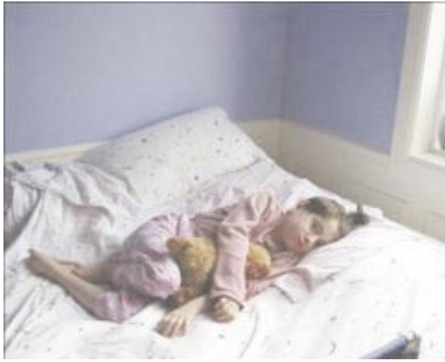
والداها قررا أن تبقى طفلة مدى الحياة!