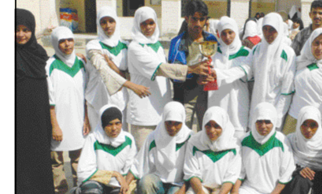
مديرية دارسعد والطرف الأخر المنصورة وهذه الرياضة دموع عمت ثابو تلمع فرحا وحزنا واخط الحابل بالنابل .