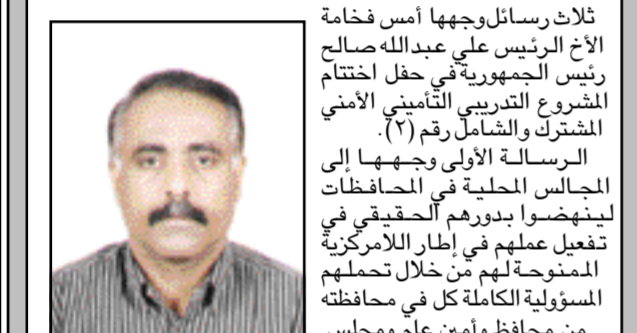
نعيل علي انعم

ثلاث رسائل وجهها أمس فخامة الاخ الرئيس علي عبدالله صالح رئيس الجمهورية في حفل اختتام المشروع التدريبي التأميني الأمني المشترك والشامل رقم (٧) الرسالة الأولى وجهها إلى المجالس المحلية في المحافظات لينهضوا بدورهم الحقيقي في تفعيل عملهم في إطار اللامركزية الممنوحة لهم من خلال تحملهم المسؤولية الكاملة كل في محافظته من محافظ وأمين عام ومجلس محلي .. موضحاً أن الحكومات المحلية هي نفسها تعني المجلس المحلية فقط سيتم تغيير التسمية وبصلاحيات أوسع .. فالسلطة المحلية هي التي تدير أمور المحافظة .. أما السلطة المركزية فتضع استراتيجيات الأمن القومي والسياسي وكل ما هو سيادي يختص بها .