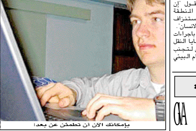
بإمكانك الآن ان تخطمن عن بعد!

واشنطن/ صحف: من الآن فصاعداً يمكنك مراقبة منزلك عن بعد من خلال برنامج "أكتف ويب كام" Active WebCam، وذلك عبر كاميرا تقوم بتتبعها أمام منزلك وتصلها بجهازك. ليس هذا فحسب بل يمكنك من خلال هذا البرنامج النقل المباشر للمناسبات والأحداث عبر مواقع الإنترنت بواسطة نقالات "آلاف تي بي (FTP)"، وذلك بحسب مجلة العالم الرقمي. إذا أردت ان تعرف المزيد يمكنك تحميل البرنامج من الموقع التالي: http://www.pyssoft.com كما يمكنك تحميله من خلال موقعه الرئيسي من خلال هذا الرابط مباشرة http://www.activewebcam.com/Downloads/AWC-PYS.exe