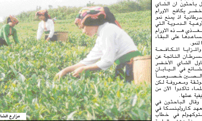
مزارع الشاي الأخضر

ستوكهولم/ متابعات: قال باحثون ان الشاي الأخضر يكافح الأورام السرطانية اذ يمنع نمو الأوعية الدموية التي تغذي هذه الأورام وتساعد على البقاء والنمو. والمزايا المكافحة للسرطان الناتجة عن تناول الشاي الأخضر الشائع في اليابان والصين خصوصا موثقة ومعروفة لكن العلماء تذكروا الآن من كيفية عملها. وقال الباحثون في معهد كارولينسكا في ستوكهولم في خطاب لصحيفة نيتشر العلمية (الطبية) ان السير يكتن في مركب "اي جي سي جي" الذي يوقف نشاط انزيم ضروري لنمو السرطان. وقال الطبيب يهاي كاو في حديث بالهاتف "توصلنا الى الآلية المحتملة التي يكافح بها الشاي الأخضر السرطان (نمو جميع الأورام يحتاج إمدادها بالدم والى نمو اوعية دموية جديدة... ونحن ندرسنا ما اذا كان تناول الشاي يمكن ان يوقف هذه الآلية)". واختبر الباحثون تجربتهم على الفئران، ووجدوا ان تناول الشاي الأخضر فقط اوقف نمو الأوعية الدموية الجديدة ومنع انتشار الأورام الى رئة الفئران. إضافة إلى ان البيئة الطبيعية للجماعة إلى ان مستويات غير مسبوقة في تاريخ الانسانية.