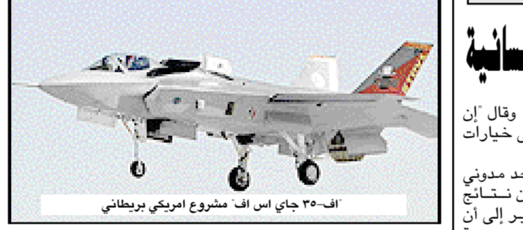
اف-٣٥ جاي اس اف مشروع امريكي بريطاني

وفي النهاية، رضخت الولايات المتحدة للضغط واعطت معلومات مهمة لبريطانيا. وبالإضافة الى الولايات المتحدة، ستشارك استراليا وكندا والبنمارك وإيطاليا وهولندا والنرويج وتركيا بتطوير هذا المشروع.