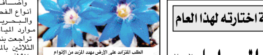
الطلب المتزايد على الأرض بعد المزيد من الأنواع

لندن/ متابعات: حذرت جماعة بيئية من أن معدلات الاستهلاك الحالية في العالم قد تؤدي إلى تدمير النظام البيئي على نطاق واسع بحلول منتصف القرن الحالي. وأشار التقرير نصف السنوي للجماعة إلى أن البيئة الطبيعية تراجت إلى مستويات غير مسبوقة في تاريخ الانسانية. وذكر التقرير أن عدد فصائل الكائنات الحية تراجع بنسبة ٢١ بالمئة في الفترة بين ١٩٧٠ و ٢٠٠٣. وأرجع التقرير سبب تراجع الموارد إلى أن سرعة الاستهلاك تتجاوز قدرة الأرض على إحلال ما تم استهلاكه. وحذر بول كيننج رئيس الجماعة من أن العالم يواجه وضعي يزداد سوءا في المنطقة الاستوائية حيث يتم استنزاف الموارد الطبيعية لصالح الانسان. وطالب التقرير بالقيام بإجراءات عاجلة فيما يتعلق بقضايا النقل والمواصلات والسكان لتجنب حدوث انهيار في النظام البيئي بحلول منتصف القرن.