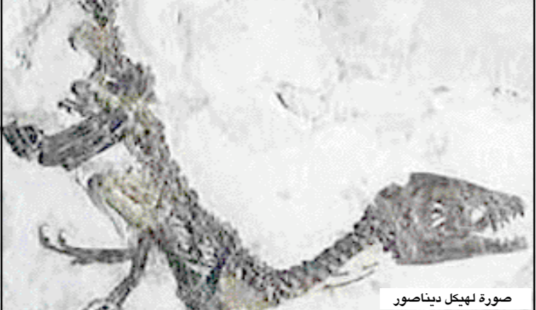
صورة لهيكل دياناصور

صغاء/ متابعات: عثر فريق جيولوجي علمي على بقايا ثلاثة دياناصورات تم اكتشافها في محافظة صغاء. وأشار الدكتور إسماعيل الجند رئيس الهيئة العامة للمساحة الجيولوجية والثروات المعدنية، بحسب "المجلة الاقتصادية" إلى أن فريقا علميا مكونا من خبراء جيولوجيين اكتشفوا بقايا دياناصورات عاشت في منطقة أرحب في محافظة صغاء خلال فترة العصر الجيوراسي. وأضاف الجند أن الفريق يستكمل حاليا الدراسات العلمية الميدانية في هذه المناطق للوصول إلى نتائج أكثر دقة وتشخيصا لهذه الكائنات المنقرضة وطبيعة الحياة التي عاشت فيها.