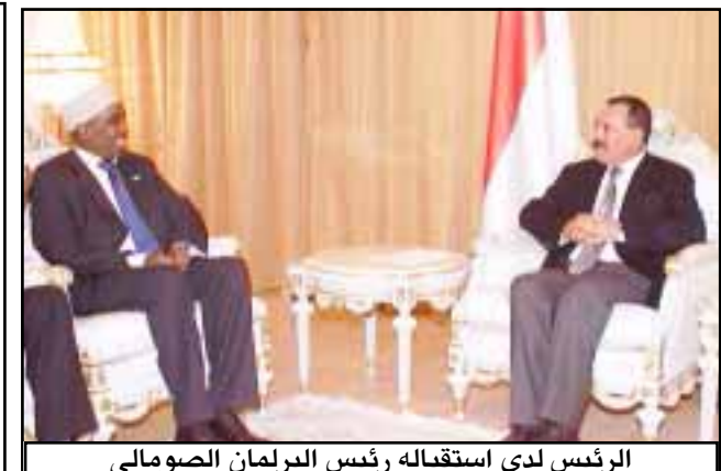
الرئيس لدى استقباله رئيس البرلمان الصومالي

الرياض / سبأ : أكد الأمين العام لمجلس التعاون الخليجي عبدالله بن عبدالعزيز آل سعود ان القمة الخليجية السابعة والعشرين المقررة في الرياض برئاسة خادم الحرمين الشريفين الملك عبد الله بن عبد العزيز ملك المملكة العربية السعودية ستناقش تعزيز التعاون الاقتصادي مع الجمهورية اليمنية . وقال الأمين العام لمجلس التعاون الخليجي عبدالله بن عبدالعزيز آل سعود ان القمة ستناقش تقرير حول النتائج الإيجابية التي خرج بها مؤتمر المانحين الذي انعقد مؤخراً في لندن لدعم التنمية الاقتصادية والاجتماعية في اليمن والذي رعته دول مجلس التعاون . وأضاف في حوار نشرته أمس صحيفة عكاظ السعودية ان مؤتمر المانحين لدعم التنمية في اليمن حقق هدفه فيما يتعلق بحشد التتمعة ص 2