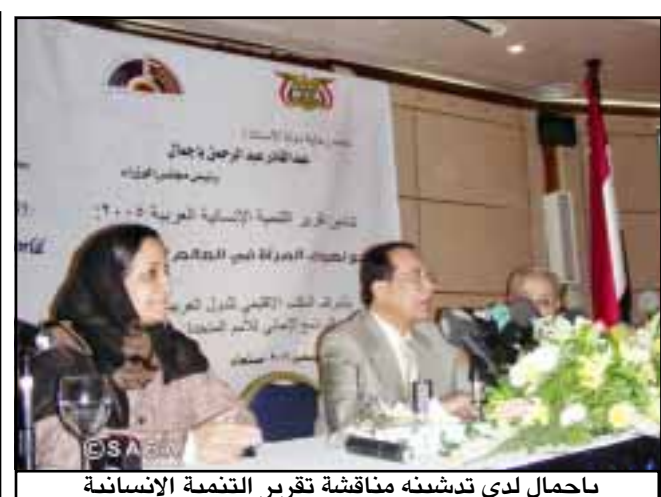
باجمال لدى تدشينه مناقشة تقرير التنمية الإنسانية

صنعاء / سبأ : وصل إلى صنعاء أمس فان دن هوت السكرتير العام لمحكمة التحكيم الدولية في زيارة لليمن تستغرق ثلاثة أيام يلتقي خلالها عدداً من المسؤولين في الجهات ذات العلاقة . وأوضح المسؤول الدولي في تصريح لوكالة الأنباء اليمنية (سبأ) ان زيارته تأتي لبحث مجالات التعاون بين اليمن ومحكمة التحكيم الدولية للمنازعات الدولية التي جانب البحث في استكمال الالتزامات القانونية لبلادنا للالتزامات لتقافية التحكيم الدولية .