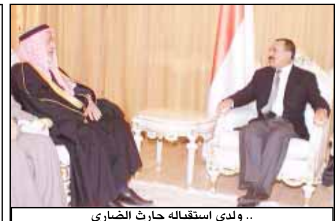
.. ولدى استقباله حارث الضاري

عدن / سبأ : استقبل فخامة الرئيس علي عبدالله صالح رئيس الجمهورية في القصر الجمهوري بعدن أمس مدير المخابرات العامة في المملكة الأردنية اللواء محمد الذهبي الذي نقل لفخامته رسالة من جلالة الملك عبدالله الثاني بن الحسين تتعلق بالقضايا والموضوعات التي تهم العلاقات الأخوية ومجالات التعاون المشترك ومنها التعاون في المجال الأمني ومكافحة الإرهاب بالإضافة إلى بعض القضايا والمستجدات التي تهم البلدين والأمة العربية . وفي المقابلة أشاد فخامة الرئيس بالعلامات الأخوية المتينة بين اليمن والأردن ومستوى التعاون المشترك القائم بينهما منها التعاون التتمعة ص 2