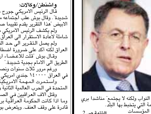
بيروت/وكالات: رست مجلس المطارة الموارنة في لبنان أمس الأربعاء، رئيس مجلس النواب نبيه بري أن يدعو الحكومة إلى الانعقاد لإيجاد مخرج للأزمة التي تخيط بها لبنان، ودعا المطارة في بيانهم الشهري عقب اجتماعهم برئاسة البطريرك الماروني بطرس صفير في العودة إلى الحوار لأنه اجدي وأكثر فاعلية، ولأن الاضرابات والاعتصامات لن تحل المشكلة. ورأى البيان ان "الوضع المربك الذي يعيشه اللبنانيون يدعو إلى الاسف الشديد وكان للحياة قد تعطلت"، وأضاف ان الشلل جعل المؤسسات الدستورية في رئاسة الجمهورية والحكومة موضوع جدل، ولم يبق إلا مجلس النواب ولكنه لا يجتمع" مناشداً بري ان يدعو إلى الاجتماع على مخرجاً للأزمة التي تخيط بها البلد. وأكد المطارة في بيانهم ان "الشلل في المؤسسات

البعثة الأوروبية تعلن تقريرها النهائي حول الانتخابات