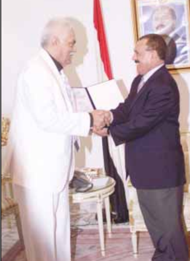
عدن / سبأ: تسلم فخامة الأخ الرئيس علي عبدالله صالح درع التميز من الجمعية الأوروبية للتسويق والتنمية تقديراً لدوره في إنجاح مؤتمر المساحين في لندن وجهوده المستمرة في مجال التنمية وتشجيع الاستثمارات العربية والأجنبية في اليمن. وقال الدكتور عبدالعزيز محمد الترب الرئيس الاقليمي للبلاد العربية بالجمعية الأوروبية للتسويق والتنمية خلال لقائه رئيس الجمهورية أمس الأربعاء بالقصر الجمهوري بعدن وتسليمه درع التميز " إن المجموعة العربية بالجمعية الأوروبية للتسويق والتنمية تتابع باهتمام التطورات المتسارعة التي تشهدها اليمن في كافة المجالات". وأشاد الدكتور الترب بالنجاحات التنموية والديمقراطية التي حققتها اليمن منذ تولي الرئيس علي عبدالله صالح رئاسة البلاد في يوليو ١٩٧٨م. يذكر أن الجمعية الأوروبية للتسويق والتنمية سبق وأن منحت رئيس الجمهورية شهادة الزمالة الذهبية في عام ١٩٩٦م.