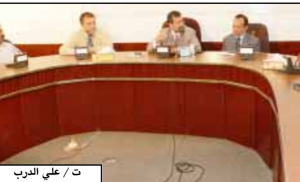
عدن / ذكرى جوه: نظمت جامعة عدن أمس محاضرة علمية عن العلاقات اليمنية الأمريكية القاها الدكتور / نبيل الخوري نائب السفير الأمريكي لدى بلادنا تطرق فيها إلى مراحل هذه العلاقات والمساندة الأمريكية الخاصة خلال فترة التسعينات وحرب الخليج وحرب صيف ١٩٩٤م، وكذلك المساهمة الأمريكية في بناء مؤسسات الدولة الجديدة. وأشار نائب السفير الأمريكي في محاضرته إلى أن اليمن اليوم محل أنظار العالم وخصوصاً بعد الانتخابات الأخيرة التي كانت أفضل الانتخابات على مستوى المنطقة في اليمن وخاصة الانتخابات الرئاسية . وأضاف أن اليمن لديه العديد من المقومات التي تعتمد عليها في الاقتصاد كالموقع الاستراتيجي، ولذا يجب مضاعفة الاهتمام في انجاز المشاريع . وأكد أن العلاقات اليمنية الأمريكية في تطور دائم ومستمر . وأوضح بأن التركيز على