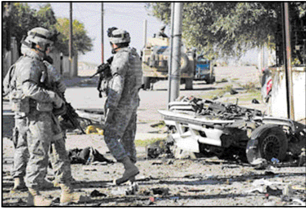
سموا بالخبراء... لانهم غير حياديين

وفي العاصمة الأردنية عمّان رحب رئيس جبهة الحوار الوطني العراقي أسد بدعوة عنان، قائلًا إنها فرصة ليتمتع المجتمع الدولي على ما يحدث في البلاد. وأعلن صالح المطلق أنه يصدد تكوين جبهة لإنقاذ العراق وتضع إضافة إلى جهته كلاً من القائمة العراقية وكتلة المصالحة والتحرير، وكذلك التيار اليساري إذا تخلى عن مليشياته الجهادية.