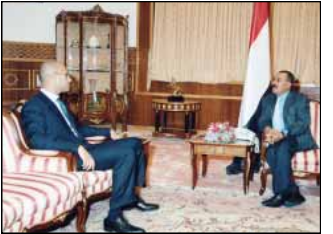
صنعاء/سبأ: استقبل فخامة الأخ على عبدالله صالح رئيس الجمهورية أسد المهندس سيف الإسلام معمر القذافي الذي يزور اليمن حالياً...