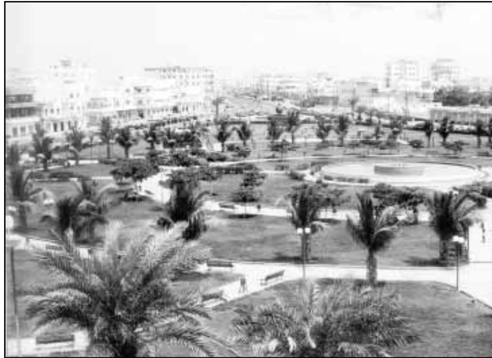
ومظلة اليوسفي. وهناك 1٨٧ مششروعاً بتكلفة ٢٠١ و٥٤٦ و٥٦١ ريالاً سيتم وضع حجر الأساس لها خلال عامي ٢٠٠٦ - ٢٠٠٧م ان شاء الله تعالى.