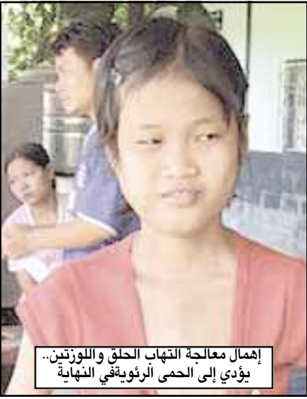
إهمال معالجة التهاب الحلق واللوزتين يؤدي إلى الحمى الرئوية والتهاب الصمامات القلبية

جدة/صحف/متابعات: الحمى الرئوية الحادة والحمى الرئوية مع التهاب في القلب، هي من أهم التهابات التي تصيب القلب وتسبب مشكلة صحية مهمة في دول العالم الثالث، كما أنها سبب رئيس للوفاة فيها. وتتبع هذه الحالة من مهاجمة الجسم بكتيريا بنوع معين يسمى ستربتوكوكس (Streptococcus) فيصيب الطفل بالتهاب في الحلق أو اللوزتين، ولذا يقوم الجسم بالدفاع عن نفسه بإنتاج أجسام مضادة مقاومة للتهاب. ولكن في حالة الحمى الرئوية فإن الأجسام المضادة تهاجم الأنسجة القارضة في الجسم مثل القلب، المخ، المفاصل والجلد وذلك نتيجة إهمال معالجة التهاب الحلق واللوزتين في الوقت المناسب. نسبة حدوث الحالات تنخفض جدا كما حدث في دول العالم الثالث. ومن هم أهم فئات المجتمع الذين لديهم نسبة أعلى للإصابة بالحمى الرئوية: