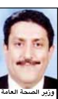
وزير الصحة العامة

القاهرة/ 14 أكتوبر أقر اتحاد جمعيات أطباء الأطفال العرب في اجتماعاته دورته الاعتيادية التي عقدها في القاهرة واختتمها يوم أمس الأول، أقر الموافقة على ترشيح د. عبدالكريم يحيى راصع وزير الصحة العامة والسكان الرئيس السابق لاتحاد جمعيات أطباء الأطفال العرب لخوض المنافسة على منصب رئيس الاتحاد الدولي لطب الأطفال، وذلك في الانتخابات القادمة المزمع عقدها في اليابان خلال العام المقبل 2007م. وكان اتحاد جمعيات أطباء الأطفال العرب قد نظم في ختام اجتماعاته في القاهرة فعالية احتفالية كرم فيها رئيسه السابق د. عبدالكريم راصع بمنحه درع الاتحاد تقديراً لما قدمه من خدمات خلال فترة رئاسته للاتحاد من خدمات إنسانية جليلة لمصلحة الأطفال على مستوى الوطن العربي واليمن. من جانبه علق د. عبدالكريم يحيى راصع على ذلك بقوله: 'إن هذا الاختيار يأتي تكريماً لليمن بشكل عام ولأطباء الأطفال اليمنيين بشكل خاص، وكذا للمكانة التي تحتلها اليمن في نفوس الأشقاء العرب، وهي مكانة تحققت لليمن بفضل فخامة الأخ الرئيس علي عبدالله صالح حفظه الله'. وأضاف: 'وجاء اختيار طبيب يمني كمرشح لرئاسة الاتحاد الدولي لطب الأطفال تجسيداُ لذلك وأنا سعيد بهذا التكريم واتوجه للاتحاد بجزيل الشكر والامتنان وإن شاء الله نكون عند حسن ظن الاتحاد'.