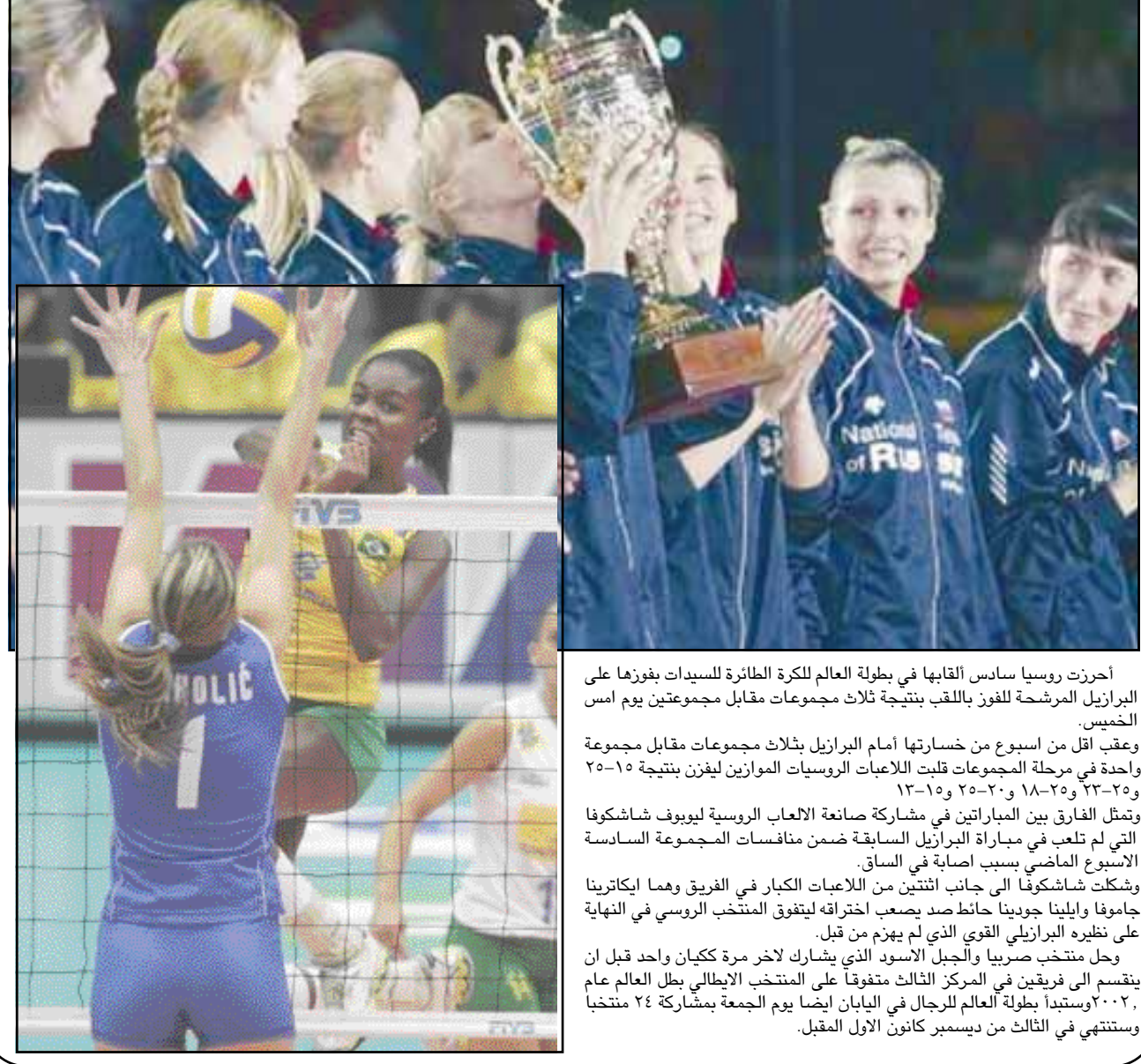
أحرزت روسيا سادس القابها في بطولة العالم للكرة الطائرة للسيدات بفوزها على البرازيل المرشحة للفوز باللقب بنتيجة ثلاث مجموعات مقابل مجموعتين يوم أمس الخميس.