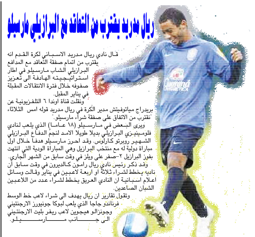
ريال مدريد يتخرب من التفاهة مع البرازيلي مارسيلو