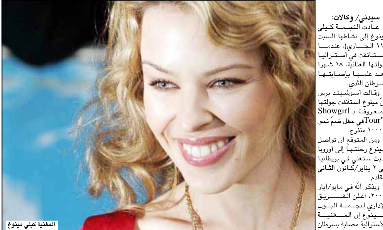
المغنية كيلي مينوغ

سيدني/ وكالات: عادت النجمة كيلي مينوغ إلى نشاطها السبب (11 الجاري)، عندما استأنفت في أستراليا جولتها الغنائية، 18 شهراً بعد علمها بإصابتها بسرطان الثدي. وقالت أسوشيتد برس إن مينوغ استأنفت جولتها المعروفة بـ "Showgirl Tour" في حفل ضم نحو 10000 متفرج. ومن المتوقع أن تواصل مينوغ رحلتها إلى أوروبا حيث ستغني في بريطانيا في 2 يناير/كانون الثاني القادم. ويذكر أنه في مايو/أيار 2005، أعلنت الفريق الإداري لـ نجمة البوب الأسترالية مصابة بسرطان الثدي وستخضع للعلاج بصورة مباشرة.