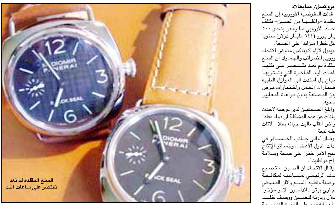
السلع المقلدة لم تعد تقتصر على ساعات اليد

بروكسل/ متابعة: قالت المفوضية الأوروبية إن السلع المقلدة -وأغلبها من الصين- تكلف الاتحاد الأوروبي ما يقدر بنحو 500 مليار يورو (644 مليار دولار) سنوياً وتمثل خطراً متزايداً على الصحة. ويقول لازلو كوفاكس مفوض الاتحاد الأوروبي للضرائب والجمارك أن السلع المقلدة لم تعد تقتصر على تقليد ساعات اليد الفاخرة التي يشتريها السياح بل امتدت إلى العوارل الطبية واختبارات الحمل واختبارات مرض الإيدز المصنعة بدون مراعاة للمعايير الصحية. والبلغ الصحفيين لدى عرضه لأحدث البيانات عن هذه المشكلة أن دواء مقلداً لأمراض القلب طليت حياته بطلاء الإثاث ليعطيه لمعة. وقال والي جانب الخسائر في عائدات الدول الأعضاء وخسائر الإنتاج أصبح الأمر خطراً على صحة وسلامة أرواح مواطنينا. وقال الاتحاد أن الصين ستصبح الهدف الرئيسي لمسعاه لمكافحة القرصنة وتقليد السلع وأثار المفوض التجاري بيتر مانلسون الأمر مؤخراً خلال زيارته للصين ووصف تقليد السلع بأنه قيد على القدرة التنافسية للاتحاد الأوروبي.