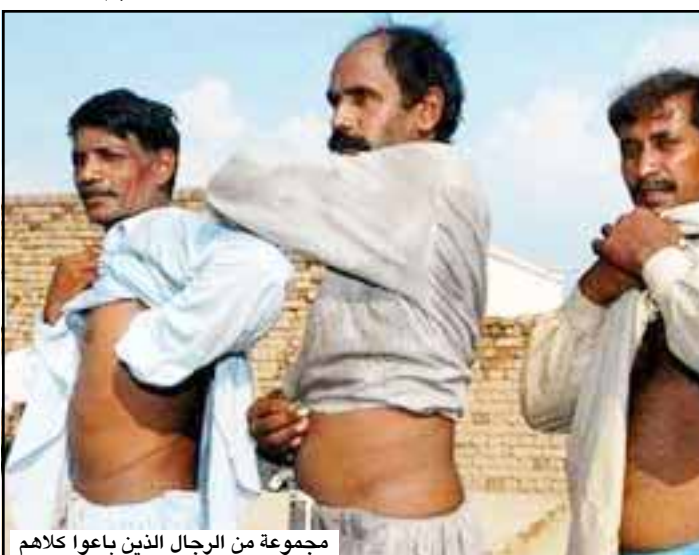
مجموعة من الرجال الذين باعوا كلائهم