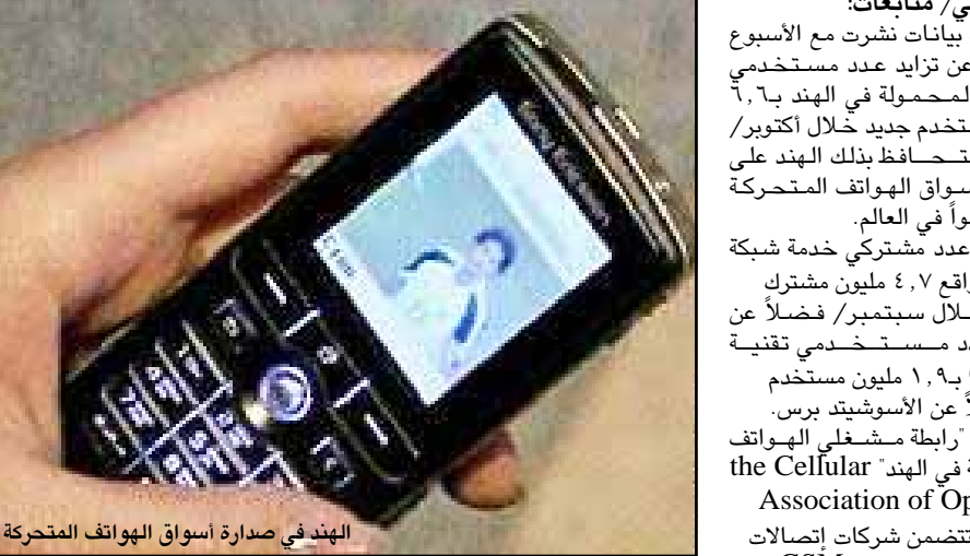
الهند في صدارة أسواق الهواتف المتحركة