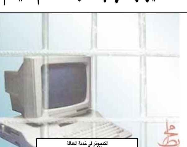
الكمبيوتر في خدمة العدالة

وأشطن/ متابعة: بعد طول انتظار أعلنت شركة مايكروسوفت عن الانتهاء من إتمام النسخة الجديدة من نظام التشغيل ويندوز فيستا، التي تحتوي على العديد من الخدمات، مثل إمكانية تسجيل الصوت والصورة، والإضافة إلى أدوات تمنح المستخدم فرصة استخدام الكمبيوتر لأغراض ترفيهية، حسبما أشار إليه جيم التشنين رئيس في وحدة مايكروسوفت. وأوضحت الشركة أنها ستوفر ويندوز فيستا لشركات الأعمال العملاقة في أروقة بورصة ناسداك بنيويورك، لتحتجبه في الأسواق لمستهلكها، ومن المتوقع نزوله في الأسواق ٢٠ يناير المقبل.