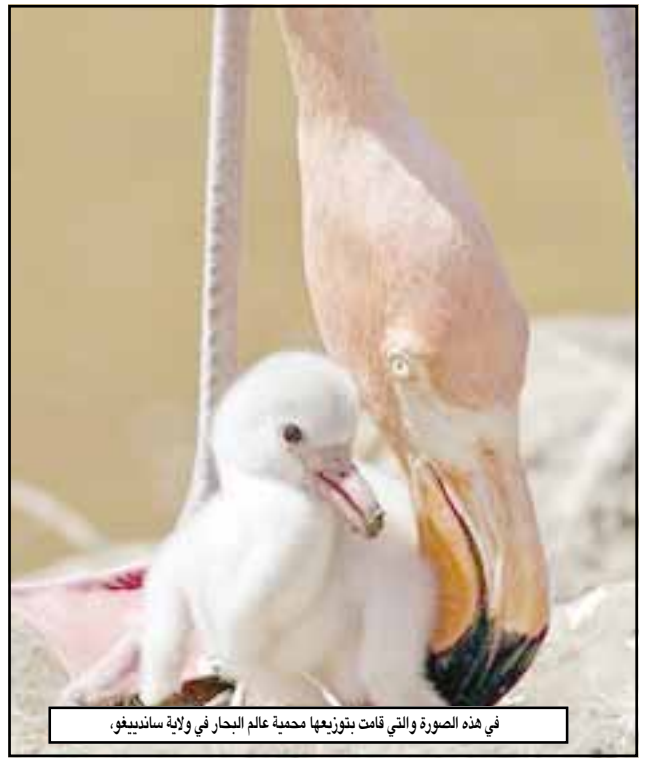
في هذه الصورة التي قامت بتوزيعها جمعية عالم البحار في ولاية سانديغو.