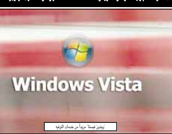
ويندوز فيستا مزيداً من خدمات الترفيه

إمكانية تسجيل الصوت والصورة وخدمة مشاهدة التلفاز وأدوات أخرى ترفيهية