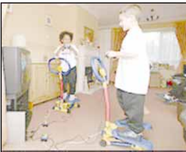
لندن / متابعات:

تم اختراع آلة جديدة لتشجيع الأطفال على ممارسة الرياضة خلال ممارستهم ألعاب الكمبيوتر. وتتألف الآلة الجديدة، التي تحمل اسم ستوب تو بلاي أو تحرك للعب، على حامل جهاز ألعاب الكمبيوتر، وتقوم فكرتها على أساس ان هذا الأخير لا يعمل إلا واللطف يمارس الرياضة حيث تؤدي ممارسته للرياضة إلى شحن جهاز التحكم. وتقول مصادر طبية إن الجهاز الجديد سيكون مفيداً، ويمكن استخدامه مع أي بلاي ستيشن. وإذا كان هناك لاعبان فعليهما استخدام جهازين وجهازي تحكم لممارسة الألعاب التي تتطلب ممارستها لاعبين. ويستهدف الجهاز الجديد الأطفال دون سن الثانية عشر. ويقول الدكتور إيان كميل المعنى بأمراض السمعة "نعم ان الأطفال لا يشمون بالشاطب الذي يجب ان يكونوا عليه". وأضاف قائلاً "إن أي شيء يشجعهم على ممارسة الرياضة سيكون عاملاً مساعداً، ولكن من المحزن ان تكون مضطرين لرشوة الأطفال لممارسة الرياضة". ومضى يقول "لا اعتقد ان هذا الجهاز سيئا، ولكنه ليس جهازاً مثالياً". وقال "إنه كان من الممكن تشجيع الأطفال على الانطلاق وممارسة الرياضة في المدرسة والمنزل، وقد يكون من الأفضل للأبوين العمل على الحد من علاقة أطفالهم بالكمبيوتر". ولكن الدكتور كولين وين رئيس المنتدى الوطني لمكافحة السمعة يؤيد هذا الاختراع مشيراً إلى أنه قد يساعد على تجنب الأطفال للسمعة عندما يبلغون.