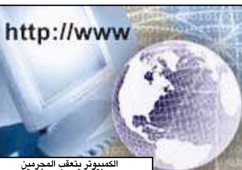
الكمبيوتر يتعقب المجرمين