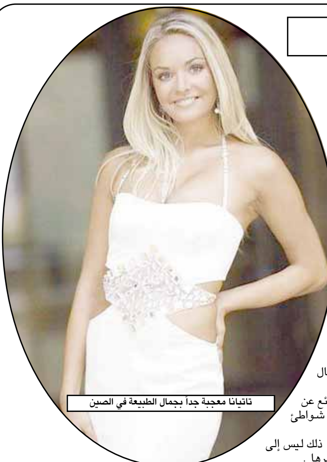
تاتيانا معجبة جداً بجمال الطبيعة في الصين

براغ / متابعات: أعلنت ملكة جمال العالم التشيكية تاتيانا كوخارجوفا، بانها تريد ممارسة العمل الدبلوماسي مستقبلاً، ما أن ينتقل لقب الملكة بعد عام إلى فتاة أخرى. وأضافت بعد عودتها إلى بلدها بعد جولة قامت بها في دول عديدة في العالم أن حلمها الكبير هو الدراسة في الجامعة. أما بالنسبة إلى العمل فإنها ستكون مسرورة لو مارست العمل الدبلوماسي أو التعامل مع وسائل الإعلام، مؤكدة أن الأمر لم يحسم بعد لديها غير أن الرغبة بممارسة العمل الدبلوماسي تتفوق على أية رغبة أخرى.