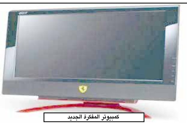
كمبيوتر المفكرة الجديد

متضمناً أحدث الابتكارات اللاسلكية. ويخفي حجم جهاز فيراري ١٠٠٠ الصغير قوته الداخلية إذ سيبتضمن الجهاز كذلك مشغلات ATA للكلاداء العالي التي لا تتوفر إلا في عدد قليل من أجهزة المفكرات الكبيرة كما يتفوق الجهاز من حيث مواصفات صغر الحجم وخفة الوزن والأداء، وذلك بفضل وزنه البالغ ١,٨ كغ والبطارية المكونة من ٦ خلايا. يعد الجهاز إضافة حقيقية لهذه المجموعة.