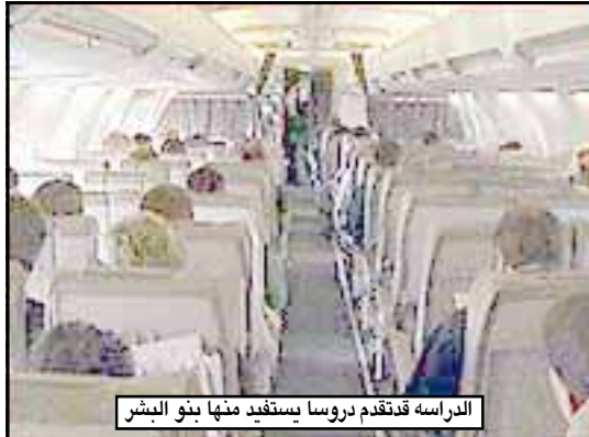
الدراسة قُدمت بروسا يستفيد منها بنو البشر