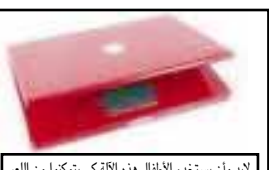
إدوان يستخدم الآلة التي يشترك في العمل

موقع آبل/ متابعات: أدرجت شركة "آبل" المعالجات المزروجة بالقوة "دوال مغنطيسي (MagSafe Air) (line) على متن الطائرات. إن يمكن للمسافر وصله بمصدر التغذية الكهربائية قرب مقعده.