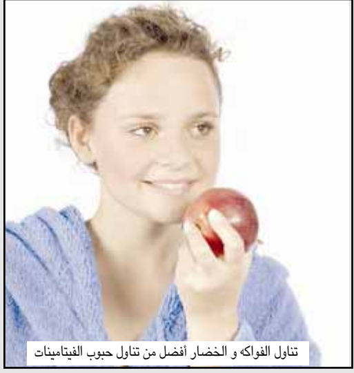
تناول الفواكه والخضار أفضل من تناول حبوب الفيتامينات