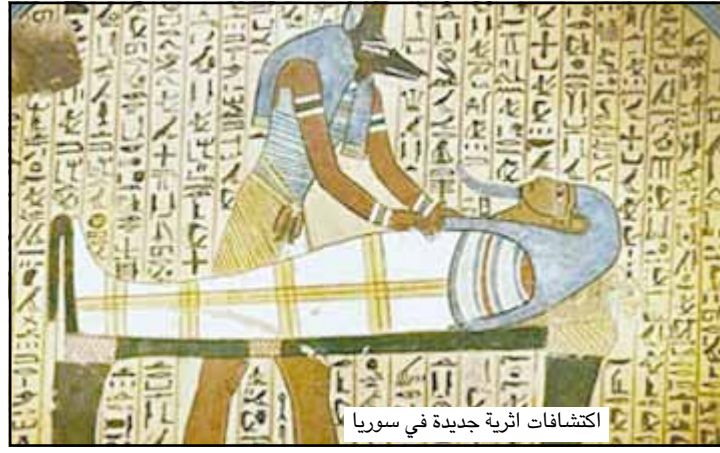
اكتشافات أثرية جديدة في سوريا

دمشق/ مواقع الإلكترونية: شهد عام ٢٠٠٦ اكتشافات أثرية هامة في سوريا قد تعيد حسابات المؤرخين بشأن بعض المسلمات التاريخية المتعلقة بتاريخ التحنيط وطرق العبادة والاستقرار عند الإنسان القديم.