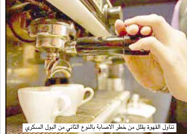
تناول القهوة يقلل من خطر الإصابة بالنوع الثاني من البول السكري

نيويورك/ متابعات: أظهرت دراسة جديدة أن عشاق القهوة تخفف لديهم مخاطر الإصابة بالنوع الثاني من البول السكري مقارنة بمن لا يحسنونها.