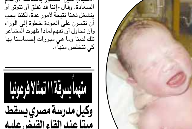
شملت عينة تألفت من ٤١ جثة لعدد من الوفيات من الأطفال، حيث كان سبب الوفاة في ٣٦ حالة منها يعود للإصابة بمتلازمة 'أس أي دي أس' أو ما يعرف بـ 'موت المهد'. فيما اختلفت أسباب الوفاة في الحالات الأخرى.

واشنطن/ وكالات/ مواقع الإلكترونية: استطاع باحثون من مستشفى بوسطن للأطفال في الولايات المتحدة، إجلاء الكثير من العووض الذي يحيط بمتلازمة الموت المفاجئ عند الرضع 'أس أي دي أس'.