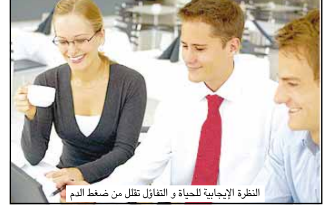
النظرة الإيجابية للحياة والتناؤل تقلل من ضغط الدم

لندن/ صحف/ متابعات: يقول بعض الباحثين من مدينة تكساس الأميركية إن التحنيط بالنظرة الإيجابية والمقاومة إلى محربات الأحداث في الحياة اليومية والشعور بعواطف عارمة بالرضا لا يعطي فقط متعة في العيش للإنسان، وخاصة كبار السن، بل يقلل من مقدار ضغط الدم لديهم أيضاً.