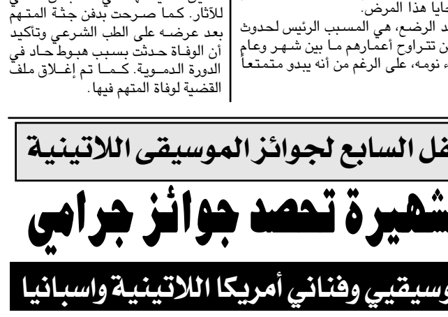
مغنية البوب اللاتينية شاكيرا تحصد جوائز جراهي

نيويورك/ متابعات: فازت مغنية البوب الكولومبية الشهيرة شاكيرا بأغنية العام وبأفضل أداء صوتي غنائي نسائي في موسيقى البوب في الحفل السنوي السابع لجوائز جراهي للموسيقى اللاتينية الخمس (٢ الجاري) لتلحق بذلك على الحصف الذي يكرم الموسيقيين من أنحاء الأمريكتين واسبانيا.