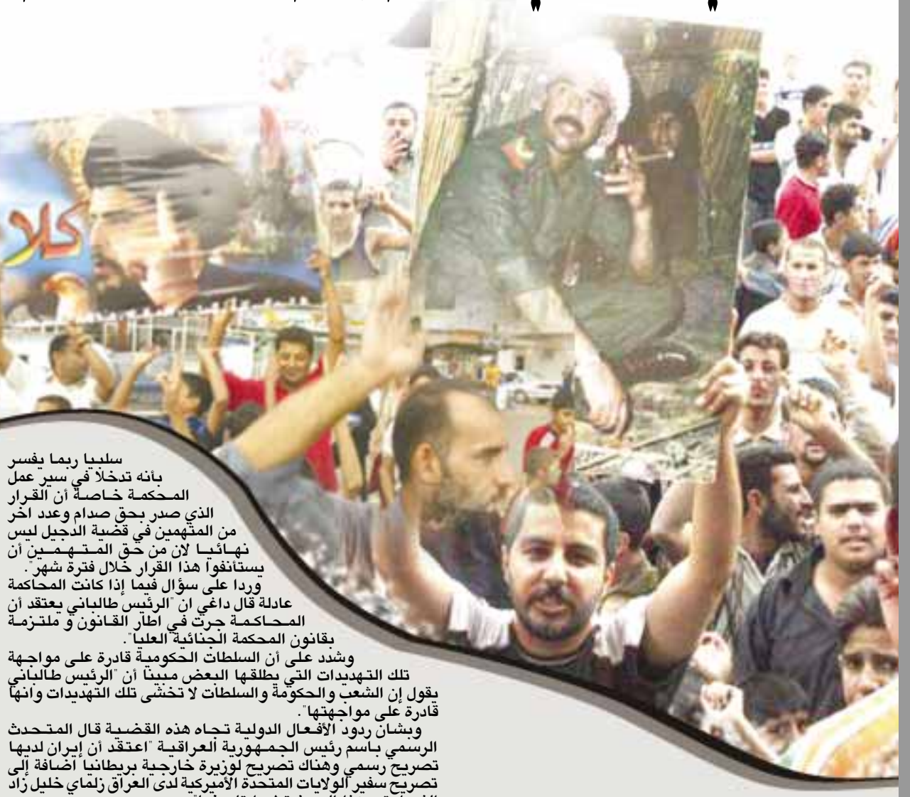
بغداد وكالات: فيما اعتبر رئيس الوزراء العراقي نوري المالكي أمس الأحد الحكم على الرئيس العراقي السابق صدام حسين بنهي حقبة مظلمة، وذلك في تصريح لتلفزيون العراقية الحكومي، تظاهر آلاف العراقيين في مدن بغداد والكوت والنجف والبصرة احتجاجاً بصور حكم قضى بإعدام الرئيس العراقي المخلوع صدام حسين في قضية مجزرة بلدة النجف في ثمانينات القرن الماضي، في حين عملت المدن السنوية تظاهرات احتجاج على هذا الحكم.

وقال المالكي في كلمة موجّهة إلى الشعب العراقي إن حكم الإعدام أيضاً صدر هو "انتصار لضحايا شهداء مجزرة النجف"، واعتبره أيضاً حكماً على "حقبة مظلمة، وليس على شخص". وأضاف أن الحكم على الديكتاتور يعد إنصافاً لعوائل ضحايا مجزرة النجف وانتصاراً لجمع ضحايا النظام البائد. وتابع إن الحكم يمثل نهاية مرحلة سوداء وبداية مرحلة جديدة لتبدأ عراق حر ديمقراطي اتحادي يسود فيه حكم القانون ودولة المؤسسات ويتساوى فيه الجميع. واعتبر أن حكم الإعدام على مجرم كصدام وأعواله لا يمثل عدوياً شيناً كبيراً وإن إعدامه لا يساوي قطرة من دم العرجم الشهيد السيد محمد باقر الصدر أو شهداء السيد محمد صادق الصدر أو الشهداء من آل الحكم وشهداء الدعوة الإسلامية والشهداء العلماء الشيخ عبد العزيز الدري والشيخ ناظم العاصي أو أي شهيد من أبناء العراق من الكر والتركمان والكلدان والشوريين.