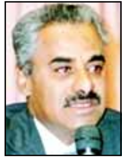
د. صالح باصرة وزير التعليم العالي والبحث العلمي

عدن / متابعة : يقعد في جامعة عدن اليوم لقاء موسعا لأعضاء هيئة التدريس بالجامعة. وقال د. صالح باصرة، وزير التعليم العالي والبحث العلمي في تصريح نشره موقع ٢٦ سبتمبر نت الألكتروني إن اللقاء الموسع الذي تنظمه نقابة أعضاء هيئة التدريس بالجامعة سيناقش عدد من القضايا والموضوعات ذات العلاقة بالارتقاء بالتعليم العالي وتحسين المستوى المعيشي لأعضاء هيئة التدريس، ومنها ما يتعلق بأليات الإحالة للتقاعد، ونظام الأجور والمرتبات لأعضاء هيئة التدريس بالجامعات اليمنية في ضوء استراتيجية الأجور، وكذا قضية التوصيف الوظيفي. وأضاف باصرة أن اللقاء سيناقش أيضاً رؤية وزارة التعليم العالي لتطوير برامج التعليم العالي وسياسات وخطط الوزارة في المرحلة المقبلة، وخاصة فيما يتعلق بتنفيذ ما أتت بها في البرنامج الانتخابي لفخامة الأخ علي عبدالله صالح، رئيس الجمهورية.