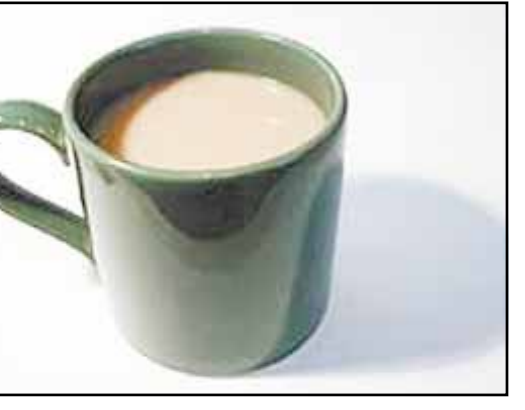
الامر الذي يعني ان الافراد الذين يعانون من الارتفاع في ضغط الدم يجب ان يتناولوا الشاي بعد تناول الوجبات.

لندن/متابعيات: السائد أن الشاي يؤدي إلى تخفيض السوائل في الجسم. ويرى العلماء أن مشرب بوليفينول، وهو من مضادات الأكسدة، الذي يحتوي عليه الشاي هو المسؤول الأساسي عن الفوائد الصحية له.