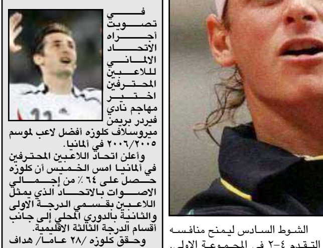
في تصويت أجراه الاتحاد الألماني للاعبين المحترفين اختير مهاجم نادي فيرير برين ميروسلاف كلوزه أفضل لاعب لوسم ٢٠٠٦/٢٠٠٥ في ألمانيا. وأعلن اتحاد اللاعبين المحترفين في ألمانيا أمس الخميس أن كلوزه حصل على ٦٤٪ من الأصوات الانتخابية بالاحتمال الذي يمثل اللاعبين بقسمي الدرجة الأولى والثانية بالدوري المحلي إلى جانب أقسام الدرجة الثالثة الإقليمية. وحقق كلوزه ٢٨ عاماً/هدف بطولة كأس العالم ٢٠٠٦ التي استضافتها ألمانيا هذا الصيف والثانية بعد الأولة الأولى لوسم ٢٠٠٦/٢٠٠٥ فوزاً كاسحاً اليوم في التصويت. وحصل مايكل بالاك نجم خط وسط نادي بايرن ميونخ الألماني السابق على ٤٩٪ من الأصوات بينما حصل تيم بوروفسكي زميل كلوزه في فيرير برين على ٣٢٪ من الأصوات. وستستلم كلوزه جائزته قبل مباراة فيرير برين المقبلة بالدوري الألماني أمام فريق بوخوم غداً السبت.