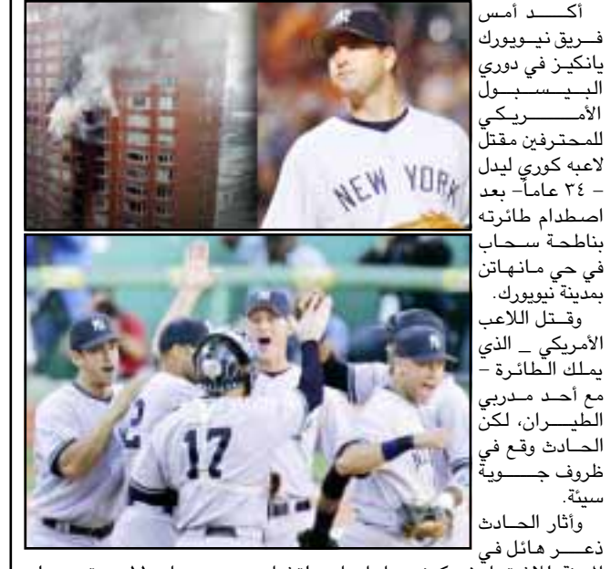
فريق نيويورك يانكيز في دوري البيسبول الأمريكي المحترفين مقتل لاعبه كوري ليدل - ٢٤ عاماً - بعد اصطدام طائرته بناتحة سحاب في حي مانهاتن بمدينة نيويورك. وقتل اللاعب الأمريكي - الذي يملك الطائفة - مع أحد مدربي الطيران، لكن الحادث وقع في ظروف جوية سيئة. وأثار الحادث ذعر هائل في المدينة للاشتباه في كونه عمل إرهابي، لتشابهه مع هجمات ١١ سبتمبر على نيويورك. وليس هذا الحادث هو الأول من نوعه في فريق يانكيز، فقد قتل في عام ١٩٧٩ اللاعب نورمان مانسون بعد تحطم طائرته. ومن المعروف أن ليدل - المنتقل هذا الموسم إلى يانكيز من فلادلفيا فيليز - حصل على رخصة الطيران العام الماضي، قبل أن يشتري طائرته الخاصة بمبلغ ١٨٧ ألف دولار.