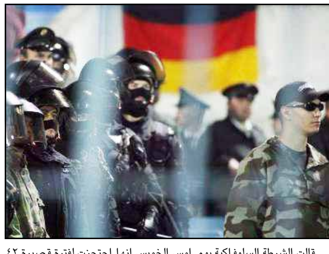
قالت الشرطة السلوفاكية يوم أمس الخميس أنها احتجزت لفترة قصيرة ٤٢ مشجعا ألمانيا بعد نشوب مشاجرة عقب هزيمة سلوفاكيا ٤-١ أمام ألمانيا في التصفيات المؤهلة لنهائيات كأس الأمم الأوروبية لكرة القدم يوم الأربعاء. وقالت الشرطة السلوفاكية أنها استجوبت المشجعين الألمان بعد تحطيم واجهة أحد المتاجر القريبة من استاد الذي أقيمت عليه المباراة ضمن المجموعة الرابعة للتصفيات وإصابة شرطي بجروح طفيفة في رأسه ونقله إلى المستشفى. وقالت الشرطة في بيان «استجوبنا المشجعين بشأن الهجوم والغرض. واطلقنا سراهم بعد الاستجواب». كما استجوبت الشرطة ستة مشجعين آخرين بعد مفاوضات مع قوات مكافحة الشغب داخل استاد خلال اللقاء. ومنع العشرات من مشري الشغب الألمان من الدخول إلى سلوفاكيا عبر الحدود لحضور المباراة. وكان مشجعين المان اشتبكوا العام الماضي مع الشرطة السلوفاكية بعد مباراة للمنتخبين الألماني والسلوفاكي في براتيسلافا.