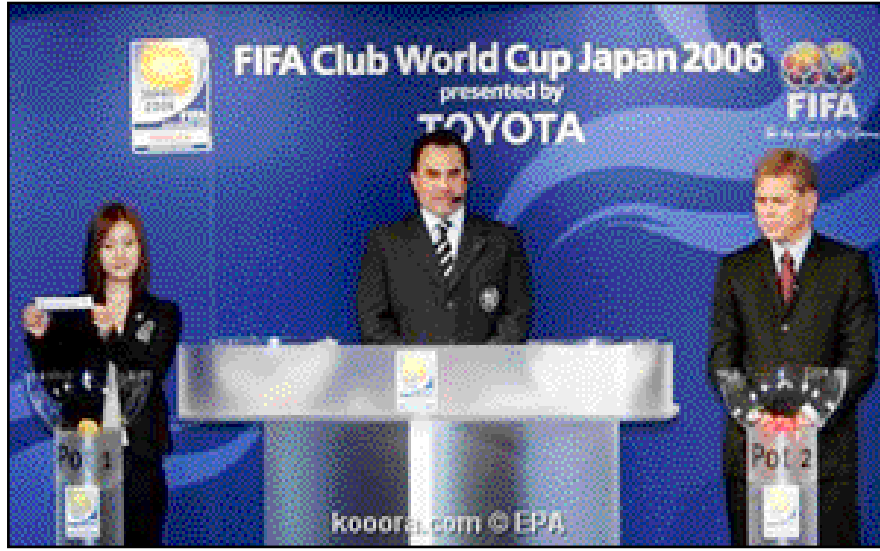
وقام فعاليات البطولة في الفترة من العاشر إلى 16 كانون الأول/ديسمبر المقبل، قبل النهائي في المباراة النهائية للبطولة على كأس العالم للأندية.

سيتمتع فريق برشلونة الإسباني بطل أوروبا بعبءة عن باقي الفرق التي ستشارك في كأس العالم للأندية التي ينظمها الاتحاد الدولي لكرة القدم (فيفا) والمقررة في اليابان في شهر ديسمبر المقبل بعد أن اتحد له قرعة البطولة التي أجريت في طوكيو الخميس يوم راحة إضافي. وسيلعب الفريق الإسباني إما مع فريق كلوب أمريكا المكسيكي بطل أمريكا الوسطى أم مع الفائز بلقب دوري أبطال آسيا هذا العام في مباراته الأولى بالبطولة في يوكوهاما في 14 كانون الأول/ديسمبر المقبل. ومن جهته سيلعب فريق إنترناسيونال البرازيلي الفائز بلقب بطولة كأس ليبرتادوريس لفرق أمريكا