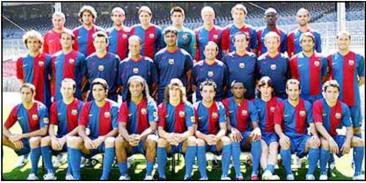
العام الماضي عقب تغلبه في المباراة النهائية على ليفربول الإنجليزي بهدف دون رد.

سيتمتع فريق برشلونة الإسباني بطل أوروبا بعبءة عن باقي الفرق التي ستشارك في كأس العالم للأندية التي ينظمها الاتحاد الدولي لكرة القدم (فيفا) والمقررة في اليابان في شهر ديسمبر المقبل بعد أن اتحد له قرعة البطولة التي أجريت في طوكيو الخميس يوم راحة إضافي. وسيلعب الفريق الإسباني إما مع فريق كلوب أمريكا المكسيكي بطل أمريكا الوسطى أم مع الفائز بلقب دوري أبطال آسيا هذا العام في مباراته الأولى بالبطولة في يوكوهاما في 14 كانون الأول/ديسمبر المقبل. ومن جهته سيلعب فريق إنترناسيونال البرازيلي الفائز بلقب بطولة كأس ليبرتادوريس لفرق أمريكا