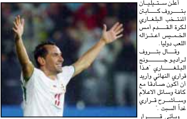
أعلن ستيليان بتروف كابتن المنتخب البلغاري لكرة القدم أمس الخميس اعتزاله اللعب دولياً.

وانتقل بتروف (٢٧ عاماً) إلى أستون فيلا الإنجليزي في شهر أغسطس الماضي قادماً من سيلتيك الاسكتلندي مقابل ثمانية ملايين جنيه استرليني (١٤.٨٦ مليون دولار) وسجل سبعة أهداف خلال ٦٦ مباراة لعبها للمنتخب البلغاري. وقال يورديان ليتشكوف نائب رئيس الاتحاد البلغاري لكرة القدم لراديو جونج «اعتقد أنه قرار عاطفي. ستحدث مع رئيس الاتحاد البلغاري بوريسلاف ميهايلوف ومدير المنتخب خريستو ستويشكوف قبل إصدار أي تعليقات أخرى».