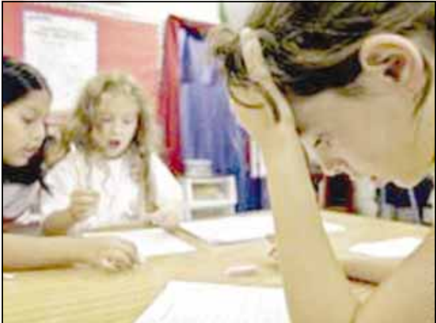
رضع أطفالهم من الثدي.

لندن/ متابعة: أظهرت دراسة جديدة من شأنها قلب المقاييس السابقة حول ارتباط غذاء الأطفال بمستوى ذكائهم، أن ذكاء الأمهات ينقل إلى الأطفال بالجينات وليس بالرضاعة، وأن الظاهرة الجديدة بالدراسة هي ميل الأمهات الذكيات إلى تغذية أطفالهن من الثدي. الدراسة التي نشرتها المجلة الطبية البريطانية قالت، إن عوامل البيئة والجينات تلعب الدور الأكبر في تحديد مستوى ذكاء الطفل وليس الرضاعة من الثدي كما ظن العلماء طوال عقود. وقال جيف دار، أحد معدي الدراسة، لوكالة الأسوشيتد برس، إن الدراسة التي شملت عينة من ١٠ آلاف أم و ٥ آلاف طفل في الولايات المتحدة، توصلت إلى نتيجة مفادها أن الأمهات الذكيات يميلن إلى بشكل عام إلى إرضاع أطفالهن من الثدي. دار الذي رجح أن يكون مستوى ذكاء الطفل قد انتقل إليه بالتالي والجينات وليس بالرضاعة، وأن الظاهرة الجديدة بالدراسة هي ميل الأمهات الذكيات إلى تغذية أطفالهن من الثدي. شأنها إسدال الستارة على النظريات القديمة حول نوعية الغذاء وعلاقته بذكاء الأطفال. من جهة أخرى رفض الدكتور مايك وولريدج المحاضر في تغذية الأطفال من جامعة ليزن التسرع في الاستنتاجات مذكراً بدراسات سابقة حملت نتائج مغايرة. وولريدج الذي قال إن الحاجة تبقى لدراسة حول دور الرضاعة كعامل مستقل هو عامل وراثي بدرجة كبيرة، ومشيداً بالدراسة التي أضعأت على هذا الجانب. وكانت الدراسة التي نشرت الخميس قد عزت تفوق الأطفال الذين حصلوا على غذاء طبيعي من ثدي عن سواء، أكد قناعته بأن حليب الأم يساهم في تحسين التركيبة الكيميائية التي يتشكل منها دماغ الطفل. غير أن الدكتور كرييس لوكاس مدير خدمات الطفولة المبكرة في جامعة نيويورك خالفه الرأي، مؤكداً أن الذكاء