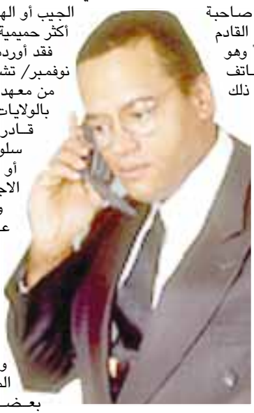
بروتوكولات نقل البيانات.

أوتاروا/ متابعة: حصلت شركة كندية على براءة اختراع لتقنية تمكن حواسيب الجيب التي تصنعها من التعرف على محيطها والتأقلم معه، وذلك كما أورد موقع مجلة نيو سياتنست العلمية على شبكة الإنترنت. فقد أعلنت شركة ريسيرتش إن موشن صاحبة براءة الاختراع، ستدمج هذه التقنية بالجيب القادم من حواسيبها المعروفة باسم «بلاك بيري» وهو من فئة حواسيب الجيب التي تعمل كهاتف نقال، وكحاسوب صغير الحجم، شأنه في ذلك شأن أجهزة «بالم» و «آي ميت». وبواسطة التقنية الجديدة ستتمكن حواسيب الجيب «بلاك بيري» من التعرف على محيطها ووضعيتها -سواء كانت في يد المستخدم، أو في جيبه، أو على منضدة، أو محفوظة في حقيبة- ثم ستغير سلوكها استجابة لهذه الوضعية. ويصدر حاسوب الجيب اهتزازة ضئيلة، بحسب تلك التقنية، أقل من تلك التي تصدرها عند تلقي اتصال هاتف أو رسالة بريد إلكتروني. وهذه الاهتزازة تساعد في تحديد وضعية. فإذا تعرف الحاسوب على أنه موضوع على منضدة، فإنه يطلق رنيناً عالياً لتنبيه مستخدمه إذا ما تلقى اتصالاً هاتفياً أو رسالة بريد إلكتروني. أما إذا كان في جيب المستخدم أو في حقيبته، فإن بروتوكولات نقل البيانات.