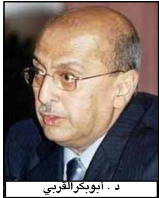
د. ديوكر الفربي

عبد الكريم الأرحبي وزير التخطيط والتعاون الدولي فجر أمس على رأس وفد اقتصادي إلى العاصمة الألمانية (برلين) في مستهل جولة تشمل عدد من الدول الأوروبية والولايات المتحدة الأمريكية وكندا. وأوضح الوزير الأرحبي لوكالة الأنباء اليمنية (سبأ) أن هذه الجولة مشروعة اقتصادية واجتماعية للتنمية والتخفيف من الفقر من خلال مؤتمر المانحين الخاص باليمن النعمة ص 2