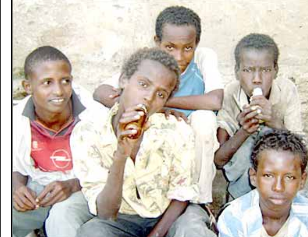
في معاناة أطفال الشوارع في مقديشو

في مقابلة خاصة مع مجلة تايم دافع الرئيس الفنزويلي عن خطابه المثير للجدل الذي أطلق فيه وصفه الشيطان على نظيره الأميركي، قائلًا إن بوش "تعتنى بما هو أسوأ من ذلك، فقد وصفني بالمستبد والكائن ومهرب مخدرات، وأنا هنا أرد عليه فقط". وقال إن بوش لا يهاجم العالم بالكلمات وحسب، بل بالقنابل، واعتقد أن القنابل التي سقطت على بغداد ولبنان ألحقت ضرباً كبيراً يفوق تأثيره أي كلام يقال داخل الأمم المتحدة. وحول دعمه للاشتراك في أميركا اللاتينية، قال شافيز إنه بعد النظر إلى إخفاق الولايات التي قامت على النظام الرأسمالي الأميركي، نجد أن الاشتراكية هي التي تستطيع أن تخلق مجتمعاً حقيقاً. وعرب شافيز عن أمه بان صوت الأمم المتحدة لمنع فنزويلا مفعدا في