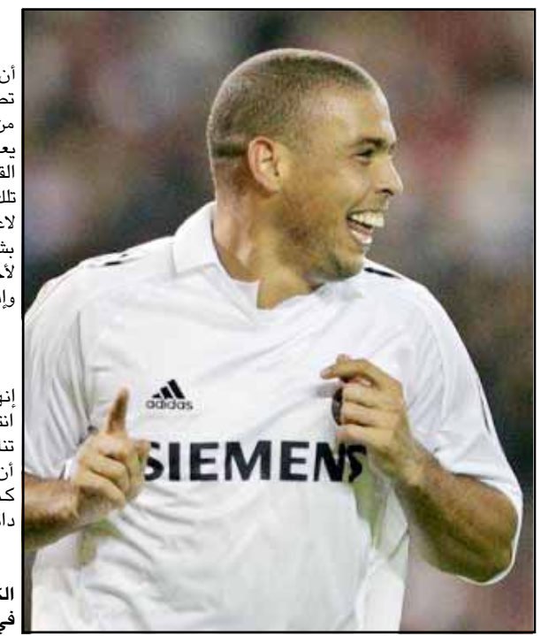
هل تعتقد انك في ريال مدريد قارون على إعادة رونالدو كما كان ؟

كيف تتعامل مع نجومية الأسماء الكبيرة ، وهل لابد من الاعتماد عليهم في المباريات ؟ نحن نعرف النجوم الذين تقوم بتدريهم جيداً ، و نعلم على عناصر معينة في تشكيل المباريات وفق أسباب و رؤى فنية وكروية بحثة ، و دعونا نقولها بصراحة الريال سوف يظل لديه مواهب كبيرة على