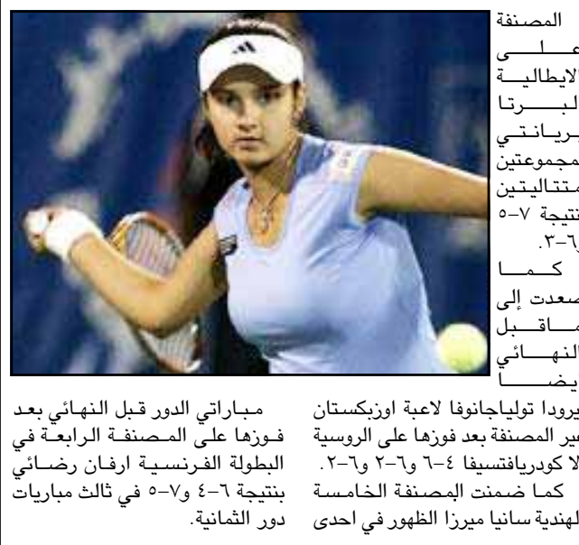
مباراتي الدور قبل النهائي بعد فوزها على المصنفة الرابعة في البطولة الفرنسية إرفان رضائي بنتيجة ٦-٤ و ٦-٢ . كما ضمن المصنفة الخامسة الهندية سانيا ميرا الظهور في إحدى دور الثمانية .

وافق الاتحاد اللبناني لكرة القدم على اقامة مباراة ودية بين منتخب لبنان والبرازيل الشهر المقبل دعماً للسلام في لبنان . وقال الاتحاد ان المباراة ستقام في بيروت يوم العاشر من اكتوبر القادم . وتأتي هذه المباراة في اعقاب الحرب التي دارت بين اسرائيل وجماعة حزب الله اللبنانية في يوليو تموز واغسطس في الماضي . وكان الرئيس البرازيلي لويس ايناسيو لولا دا سيلفا أعلن الشهر الماضي استعداده لمنتخب بلاده لخوض مباراة ودية مع نظيره اللبناني دعماً لحلحلة السلام في لبنان . من المرجح ان يخوض المنتخب البرازيلي المباراة بكامل نجومه ويأتي في مقدمتهم رونالدو وريوتو كارلوس وكاكا مع احتمال مشاركة النجم الفرنسي زين الدين زيدان الذي اعتزل اللعب في اعقاب نهائيات كأس العالم الأخيرة في ألمانيا .