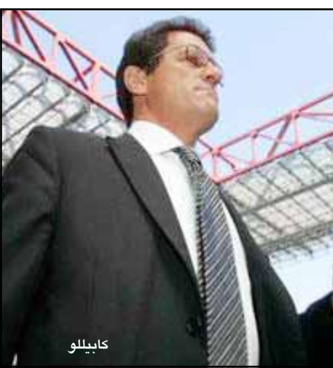
دكة البلاء !!

ان ما فجرته الي بي بي سي سوف يكون ماله الي حفظ التحقيقات دون ادانة احد كما حدث معه عام ٢٠٠٢ حينما تم توجيه ملاحقة من الاتحاد الانجليزي لكرة القدم الي نادي أستون فيلا بمرافقة صفقات انتقال الأجنبيات ، ولم تتم ادانته بشكل صريح في تلك القضية ، و أكد جريجوري ان ارتفاع مستوى التقنيات هذه الأيام خاصة في التصوير يعد من الأشياء التي تجعله يتشكك في صحة ما قامت الي بي بي سي بعرضه على أنه تسجيل بثت حصول نجل الاربيس على مبلغ مالية على سبيل الرضعية يعلم والده ، و شدد جريجوري على ان رجل بحجم الاربيس سوف يظل يعاني فترة كبيرة قبل ان يشعر انه تعافى من الآثار السلبية الهائلة لتلك الاتهامات حتى لو اثبتت التحقيقات براءته ، و هو ما يتوقعه جريجوري حيث يرى انه لا يوجد دليل قاطع من الناحية القانونية على صحة الاتهامات او على صحة التسميحات ، ويتوقع ان يقوم الاتحاد الانجليزي بحفظ التحقيقات دون ان تتم ادانة احد .