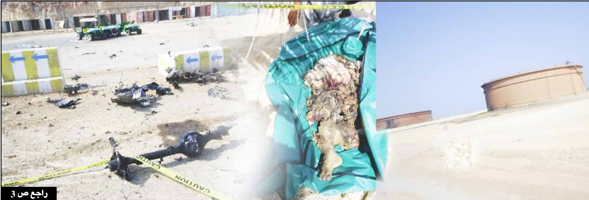
راجع ص 3