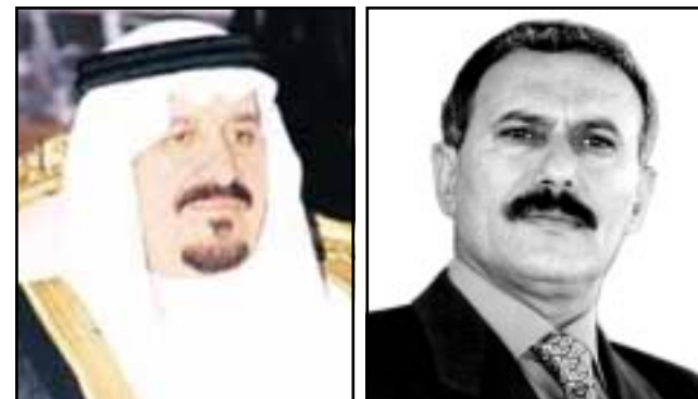
صنعاء / سبا: تلقى فخامة الأخ الرئيس علي عبدالله صالح رئيس الجمهورية أمس اتصالاً هاتفياً من صاحب السمو الملكي الأمير سلطان بن عبدالعزيز ولي العهد نائب رئيس الوزراء وزير الدفاع والطيران والمفتش العام بالملكة العربية السعودية، أطمأن خلاله على الوضع في ضوء ما جرى أمس من عمل إرهابي تم إحباطه في مأرب وحضرموت معبراً عن إنفاقه لهذه الأعمال الإرهابية التي تهدد الأمن والاستقرار. وأكد مائة العلاقات الأخوية التي تربط الشعبين في البلدين الشقيقين مشيراً إلى أن ما هم المملكة بهم اليمن وما يوم اليمن بهم المملكة. كما عبر خلال الاتصال عن تعازيه في ضحايا حادث التدافع بالإستاد الرياضي بمدينة إب شهيداً الديمقراطية سائلاً الله أن يتخذ أرواح الشهداء بواسع رحمته ويستهدف مسجع جثاته ويهلم قلوب أهلهم ونوهم الصبر والسلوان وأن يمل على المصائبين بالشفاء العاجل.