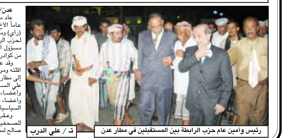
رئيس وأمين عام حزب الرابطة بين المستقبليين في مطار عدن