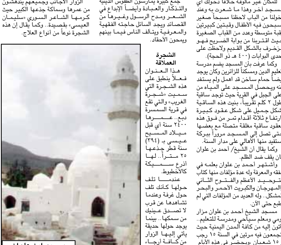
مسجد ابن علوان