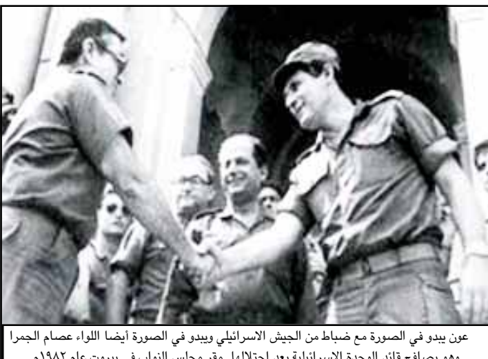
عون يبدو في الصورة مع ضباط من الجيش الإسرائيلي ويبدو في الصورة أيضا اللواء عصام الجرحا وهو يصافح قائد الوحدة الاسرائيلية بعد احتلالها مقر مجلس النواب في بيروت عام 1982م البقية ص 2

يقع في خانة الجنائيات، وكانت صحيفة (المستقبل) نشرت يوم أمس الأول صورة لرئيس كتلة التغيير والإصلاح البرلمانية العماد ميشال عون، بعد حوالي أربعة أشهر من المناسي والمجازر التي لحقها الحصار الإسرائيلي في بيروت، مزهواً بالصافحة الحميمة بين اللواء عصام أبو جرحه ممثلاً عن قيادة الجيش وبين قائد وحدات الاحتلال الإسرائيلي التي أشرفت على حصار بيروت كجزء من اجتياح لبنان وقتل أبناء قسماً وغارات وقتلها وتجويعاً. وقد ظهر في الصورة اللواء عصام أبو جرحا الذي رشحه مؤخرًا العماد ميشال عون زعيم التيار الوطني الحر والشيخ حسن نصر الله الأمين العام للحزب الله أخيراً لتسلم حقيبة وزارة العدل.!!! وسخرت صحيفة (المستقبل) لدى نشرها صورة النائب ميشال عون من مطالبته بالتحقيق مع وزير الداخلية بالوكالة أحمد فتفت بالاستناد إلى مسؤوليته عن تكتة مرجعيون التي أخلتها القوة الأمنية المشتركة بعد احتلالها من جيش العدو الإسرائيلي في يوليو 2006، منوهة بأن العماد ميشال عون الذي ظهر في قناة (ANB) وهو يشن نيران غضبه على وزير الداخلية أحمد فتفت والقوة الأمنية في مرجعيون، كان قد ظهر في عام 1982، وبعد حوالي أربعة أشهر من المناسي والمجازر التي لحقها الحصار الإسرائيلي في بيروت، مزهواً بالصافحة