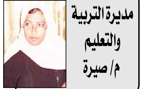
مديرة التربية والتعليم / م صيرة

إنها إشراقة الأمل والطموح والحياة المتجددة عبر جذوة العقل البشري بمواهبه وقدراته التي لا حدود لها.. إنها سيمفونية الحياة والأمل.. التي ينسج آيات عشقها هؤلاء الأبناء.. ونحن نراهم كأزهار ربيعية في رحلة عودة متجددة إلى محراب تعليمهم.