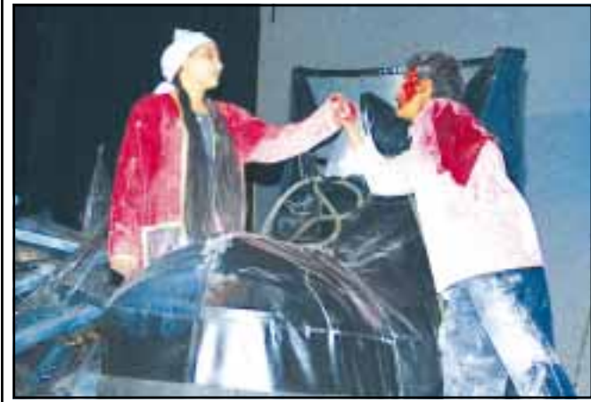
صنعاء/ سبأ بدأت أمس عدد من الفرق المسرحية تقديم عروض مسرحية متنقلة في معظم محافظات الجمهورية للتوعية الانتخابية.