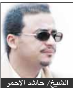
الشيخ / حاشد الأحمر

وكشف وكيل وزارة الشباب والرياضة عبدالله صالح - رئيس الجمهورية - حفظه الله - لإيلاء رياضة الفروسية ما تستحق من الرعاية والاهتمام وإن الوزارة في ظل قيادة الأخ / عبدالرحمن محمد الكوع وزير الشباب والرياضة اللجنة الأولمبية تنظر للتوجهات كبرنامج عمل لتشجيع رياضة الفروسية التطور التنامي في ظل العمل كفريق واحد مع قيادة الاتحاد الجديد والذي حرصت الوزارة على اختيارهم باعتباره ملك الخيل ومن فرسانها والمحبين لها كقديروهم واعترافاً بتحقيقهم لمصلحة الفروسية في بلادنا .