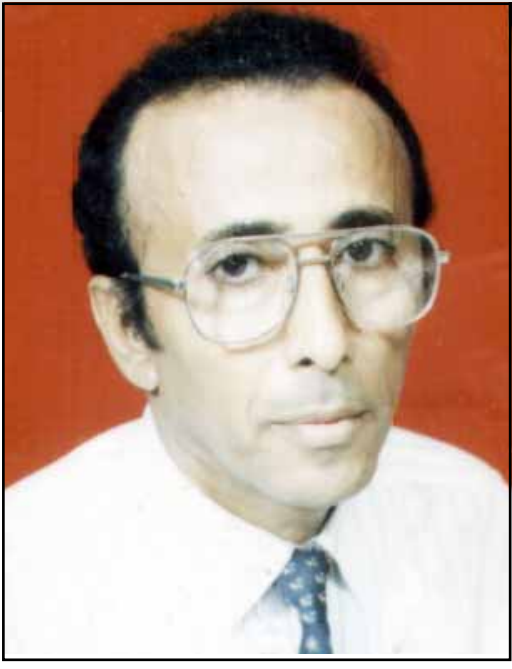
تطواف فني جميل