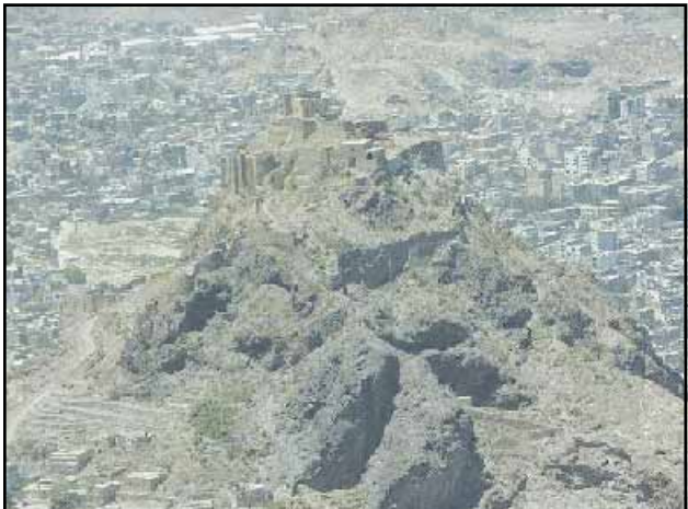
تعز / سبا

عبر الأخر عبد العزيز عبد الغني رئيس مجلس الشورى عن إعجابيه بالمشاريع التنموية والخدمية المنفذة والجاري تنفيذها حالياً في مديرية الشمايتين بمحافظة تعز. وقال: إن النمو الذي تم إحرازه على الصعيد مشاريع التنمية في مديرية الشمايتين لم يقتصر على المستوى الكمي فقط ولكنه شمل الجانب النوعي ما أتاح تأمين كافة احتياجات المديرية من مشاريع البنية التحتية والخدمات مختلف مجالاتها بما في ذلك التعليم العالي والفني وخدمة الرعاية الصحية الشاملة.