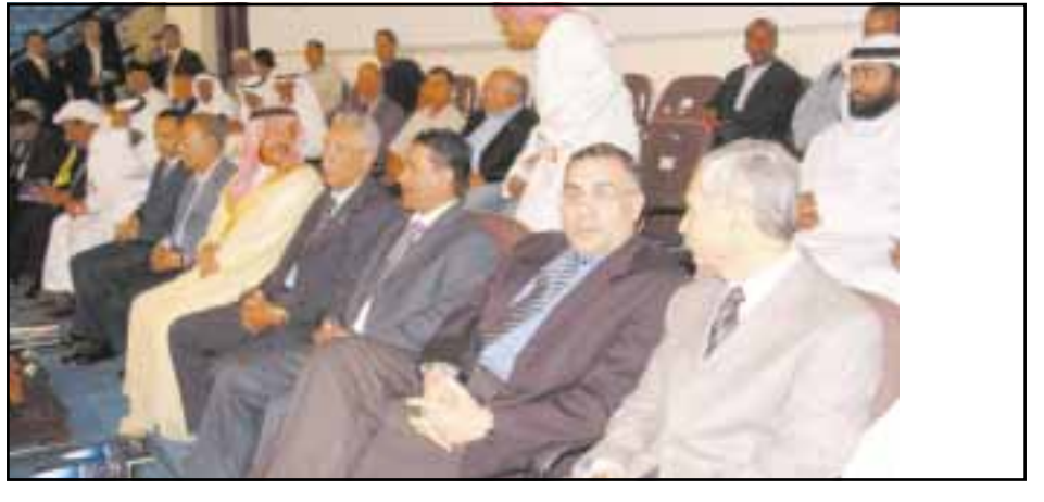
صنعاء / وهيبه البحري

وسط حضور جماهيري مميز وعلى انغام الموسيقى الرومانسية افتتحت في صالة ٢٢ مايو الدولية في العاصمة صنعاء، فعاليات البطولة العربية العشرين لكرة الطاولة التي تستضيفها بلاننا حالياً وذلك للفترة من ٣ - ٢٠/٨/٢٠٠٦م وتشارك فيها (١٧) دولة عربية منها (٤) دول مستشارك في اجتماعات الاتحاد العربي وتضم البطولة المشاركة بفئات الرجال والسيدات والنشئين والشابات والاشبال وذلك في حفل افتتاح كبير بدأ مراسيمه بتلاوة آيات عطرة من القرآن الكريم ثم وقف جميع الحاضرين الذين كان في مقدمتهم الاخوة عبدالله الشيبيري وزير الدولة امين عام رئاسة الجمهورية وعبد الرحمن الأكوع وزير الشباب والرياضة ونبيل الفقيه رئيس الاتحاد العام للطلاوة وزير السياحة وعدد من السفراء ووكلاء الوزارات وممثلين عن الاتحاد العربي دقيقة حداد على ارواح الشهداء في لبنان وفلسطين والعراق ومن ثم تم تقديم استعراض للوحة فنية اكثر من رائعة مصاحبة لدخول الفرق المشاركة تخللتها مجموعة من الاعاني والرقصات الشعبية كما ابرزت من خلالها الموروث الشعبي اليمني والذي نال استحسان الحاضرين والضيوف الكرام وتعتبر هذه اللوحة واحدة من الاعمال المميزة للمخرج فريد الظاهرة والمعدة خصيصاً لافتتاح البطولة وفي نهايتها قام اول عبدالله حسين الشيبيري وزير الدولة امين عام رئاسة الجمهورية وراعي الحفل باعلان انطلاق البطولة ليأتي بعدها اجراء اول مباراة في البطولة التي جمعت لاعبي منتخب البحرين بفرقة الرجال لتكون مباراة الافتتاح والتي اقيمت وسط هتافات عالية وتصفيق حار لنجوم طاولة بلاننا وانتهت المباراة بفوز منتخبنا ٣/٢ فيما تعد صباح اليوم السبت اجتماعات اللجان الفنية والاعلامية واللجنة التنفيذية للاتحاد العربي لكرة الطاولة ومساء تستكمل باقي لفات المنتخبات المشاركة.