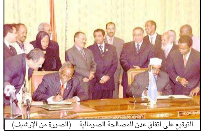
التوقيع على اتفاق عدن للمصالحة الصومالية .. (الصورة من الإريشيف)