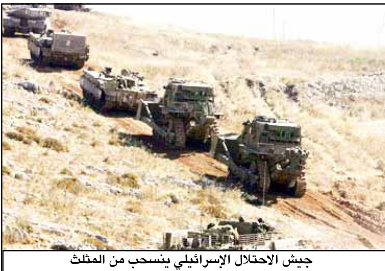
جيش الاحتلال الإسرائيلي ينسحب من المثلث