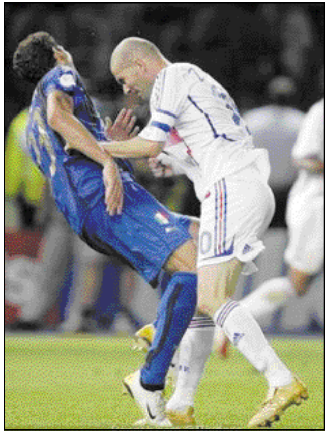
المنتخب الإيطالي بقيادة روبرتو دونادوني يواجه المنتخب الفرنسي بقيادة زين الدين زيدان في مباراة تصفيات كأس العالم في روما.

وكان دونادوني (42 عاماً) خلف مارتشيلو لوبي في منصب المدرب بعد المونديال ووقع على عقد مع الاتحاد لمدة عامين حتى أمة أوروبا 2008 وكان توتي المح أكثر من مرة خلال المونديال إلى احتمال اعتزاله اللعب دولياً ، لكنه تراجع بعد تدويع المنتخب الإيطالي قائلاً "أعرف بعد ما إذا كنت سأتوقف، هناك نسبة 50 في المئة من هذا الاحتمال بعد هذه المسيرة". علي أن فكر في الأمر.