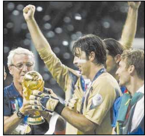
١٩٥٤ في سويسرا

برلين: بات قائد منتخب فرنسا لكرة القدم زين الدين زيدان رابع لاعب في تاريخ النهائيات يستجبل هدفين في مباراتين نهائيتين مختلفتين بعد البرازيل فافا والألماني بول براينتر عندما افتتح التسجيل من ركلة جزاء لمنتخب بلاده في مرمى إيطاليا في الدقيقة السادسة من المباراة النهائية لمونديال ألمانيا على ملعب برلين الأولمبي. وكان زيدان سجل هدفين في نهائي مونديال ١٩٩٨ في مرمى البرازيل في المباراة التي انتهت بفوز فريقه ٣-٢ صفر. أما فافا فسجل في نهائي عام ١٩٥٨ في مرمى السويد (٣-٥)، وفي نهائي عام ١٩٦٢ في مرمى تشيكوسلوفاكيا (١-٣)، في حين سجل براينتر في نهائي مونديال ١٩٧٤ في مرمى هولندا (١-٢)، ثم في نهائي مونديال ١٩٨٢ في مرمى إيطاليا (٣-١).